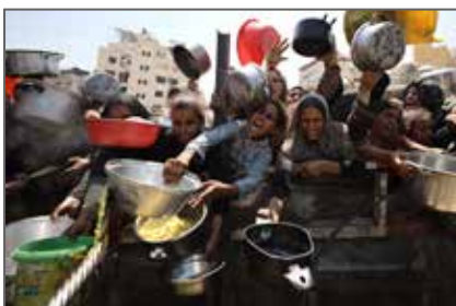
Lauréat 2026 du Visa d'or humanitaire du Comité international de la Croix-Rouge (CICR)

Pour la troisième fois, le Département des Pyrénées-Orientales offre un prix de 8000 euros au gagnant du Visa d'or des Solidarités.