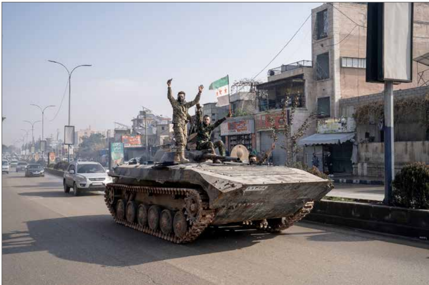
Lauréat 2026 du Visa d'or de la Ville de Perpignan Rémi Ochlik