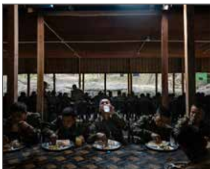
Lauréat 2026 du Prix Camille Lepage soutenu par La SAIF