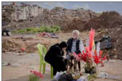
Lauréat du deuxième Visa d'or Online soutenu par le Douglas Kirkland Estate

Pour la quatorzième année consécutive, ce Visa d'or est doté par Le Figaro Magazine de 8000 euros.