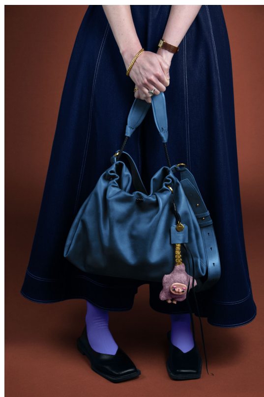
Fortuitous Witness

Marie Blampain est photographe conceptuelle, née en 1992 en Nouvelle-Calédonie et actuellement basée au Mexique. Son travail s'ancre dans une pratique photographique en studio, nourrie par une réflexion existentielle. Elle met en scène le corps humain et des situations familières pour révéler des moments de transition, de transformation et de devenir.