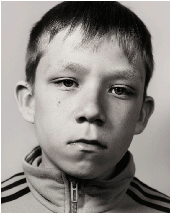
Teenage Portraits

Alternant portraits serrés et scènes du collège, la série explore les codes d'une adolescence rurale tout en convoquant des archétypes (élève populaire, punk, nerd). Les espaces, presque vides, donnent aux images une dimension universelle.