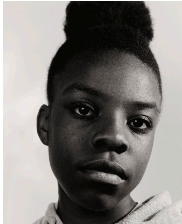
Teenage Portraits © Jérémie Monnier

Teenage Portraits documente les adolescents du collège Évariste Galois à Breteuil-sur-Iton, village isolé de Normandie. L'artiste, originaire de la région, observe une jeunesse marquée par l'éloignement et la précarité, qu'il raconte à travers visages et styles.