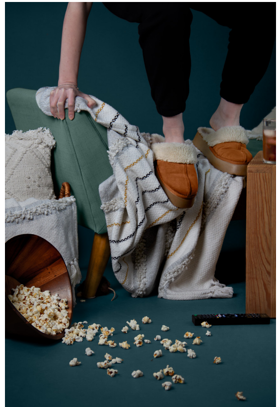
Fortuitous Witness

Fortuitous Witness (Témoin Fortuit) est une série photographique conceptuelle qui suspend volontairement l'identité individuelle au profit d'un espace de projection du spectateur à travers la position et la présence des sujets. Chaque image saisit un fragment de temps ordinaire, des instants situés en dehors des jalons ou des célébrations, rarement conservés dans la mémoire malgré leur récurrence dans le quotidien.