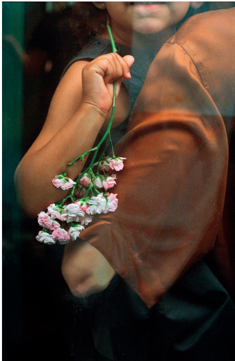
La Chapelle © Cassandre Lafon