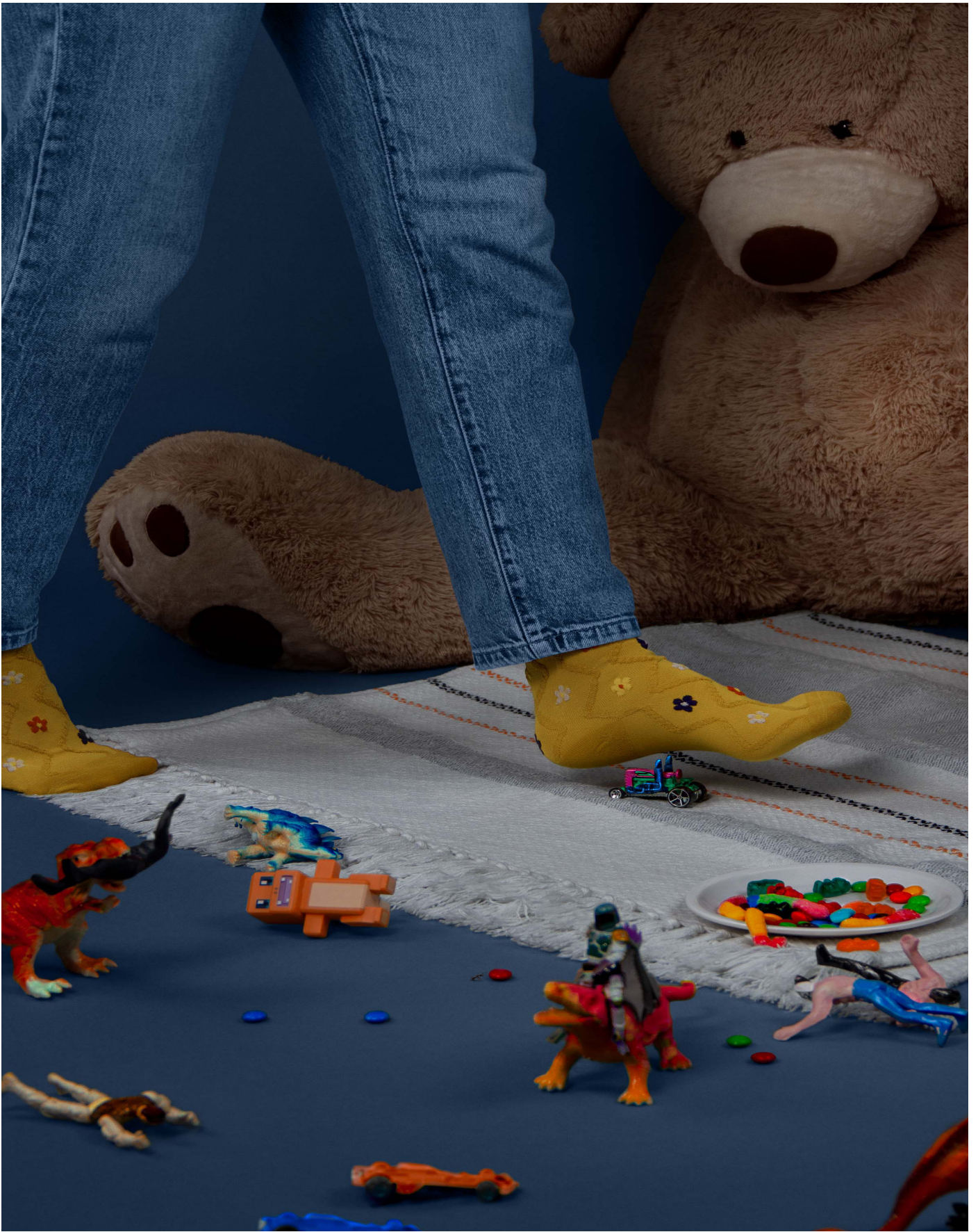
Fortuitous Witness © Marie Blampain