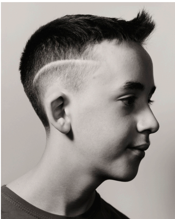
Teenage Portraits

Alternant portraits serrés et scènes du collège, la série explore les codes d'une adolescence rurale tout en convoquant des archétypes (élève populaire, punk, nerd). Les espaces, presque vides, donnent aux images une dimension universelle.