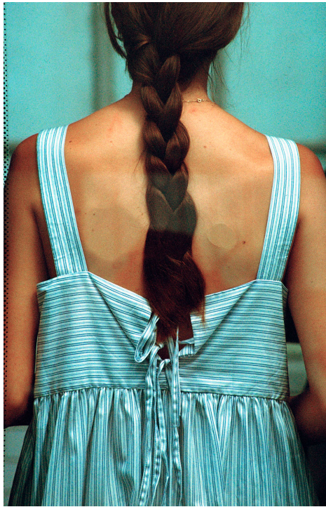
La Chapelle

La Chapelle est une série de 50 photographies argentiques réalisées entre 2023 et 2025 sur le quai de métro de mon quartier à Paris. La série mêle images documentaires et mises en scène afin de retrouver un rapport plus direct à la matière du vêtement. Ce projet fait écho à mon rythme de vie contrasté entre photographe de vêtements de marques haut de gamme et ma vie modeste dans un quartier populaire. La série a été exposée à l'Union de la Jeunesse Internationale (TATI) en 2025, et un livre est actuellement en préparation avec le Mentorat Wise Woman 2026, dont ce projet est lauréat.