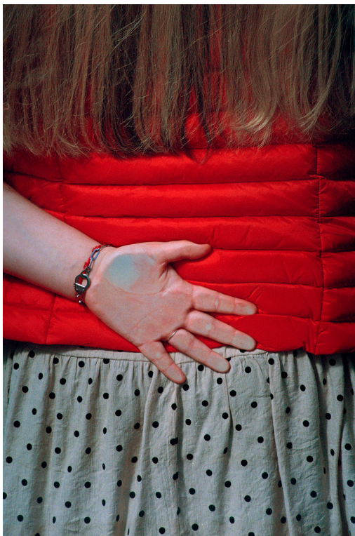
La Chapelle

La Chapelle est une série de 50 photographies argentiques réalisées entre 2023 et 2025 sur le quai de métro de mon quartier à Paris. La série mêle images documentaires et mises en scène afin de retrouver un rapport plus direct à la matière du vêtement. Ce projet fait écho à mon rythme de vie contrasté entre photographe de vêtements de marques haut de gamme et ma vie modeste dans un quartier populaire. La série a été exposée à l'Union de la Jeunesse Internationale (TATI) en 2025, et un livre est actuellement en préparation avec le Mentorat Wise Woman 2026, dont ce projet est lauréat.