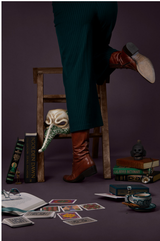
Fortuitous Witness © Marie Blampain