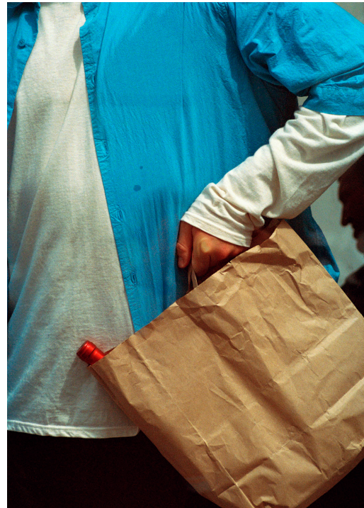
La Chapelle

Cassandre Lafon est réalisatrice et photographe basée à Paris. Née en 1995 à Lyon, elle est diplômée de l'École supérieure d'Art et de Design de Saint-Étienne, où elle découvre le journal filmé des années 60-70 et les vidéos familiales de sa mère, influences majeures de son travail. Son approche intime privilégie les plans rapprochés et une esthétique du quotidien qu'elle assemble en « bouquet d'images ». Elle collabore avec le designer Andry Adolphe sur le projet Floregraphies et avec des musiciens comme Tasho Ishi.