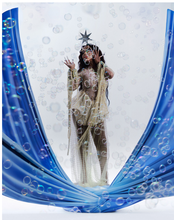
CARRANCA