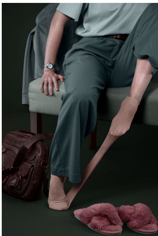
Fortuitous Witness © Marie Blampain