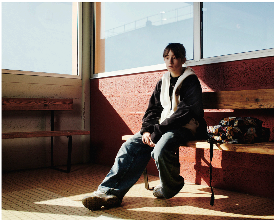
Teenage Portraits

Né à Rennes en 1993 et ayant grandi dans la campagne normande, Jérémie Monnier découvre le monde à travers les films et les romans. Installé à Paris après le lycée, il étudie le cinéma à l'université Paris 1, où il obtient un master 2 en esthétique du cinéma. Son mémoire analyse le passage du texte au film dans la collaboration entre Joseph Losey et Harold Pinter.