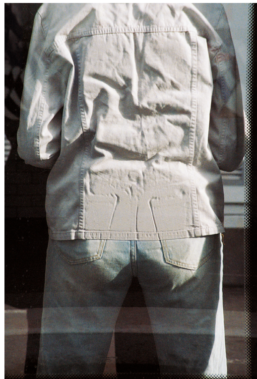
La Chapelle