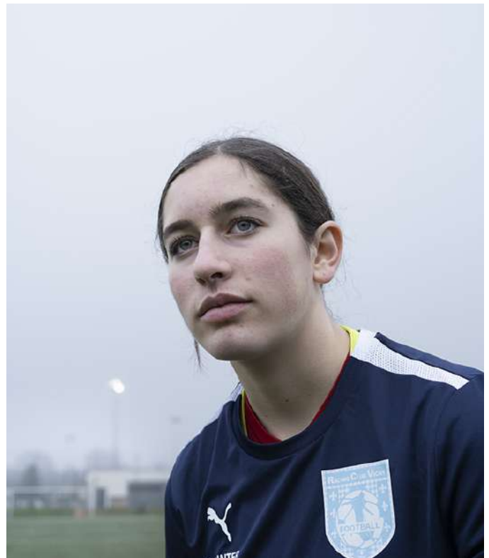
Lili, Racing Club Vichy, 2024, série Fantaisie football clubs