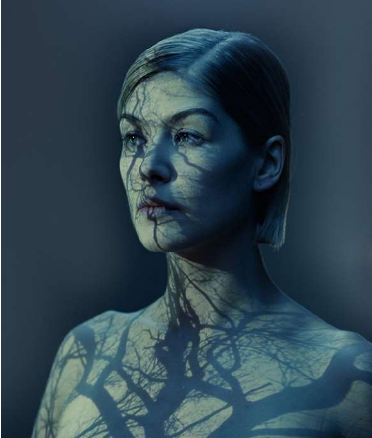
Rosamund Pike II, Los Angeles, USA, 2014

Nadav Kander est représenté par la Flowers Gallery, à Londres, Howard Greenberg Gallery à New York.