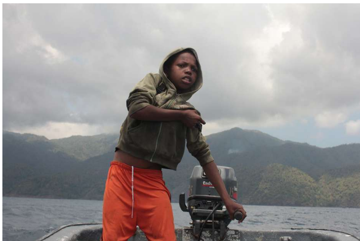
Sans titre, La Réunion. Série La Cinquième île