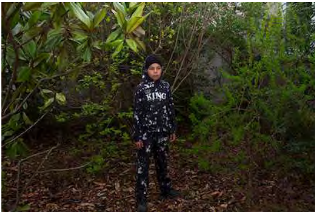
Portrait(s) s'invite à l'école - Ecole Paul Bert, 2024

Cet atelier est rendu possible par les actions conjointes des instituteurs de l'école élémentaire Paul Bert et de la Ville de Vichy.