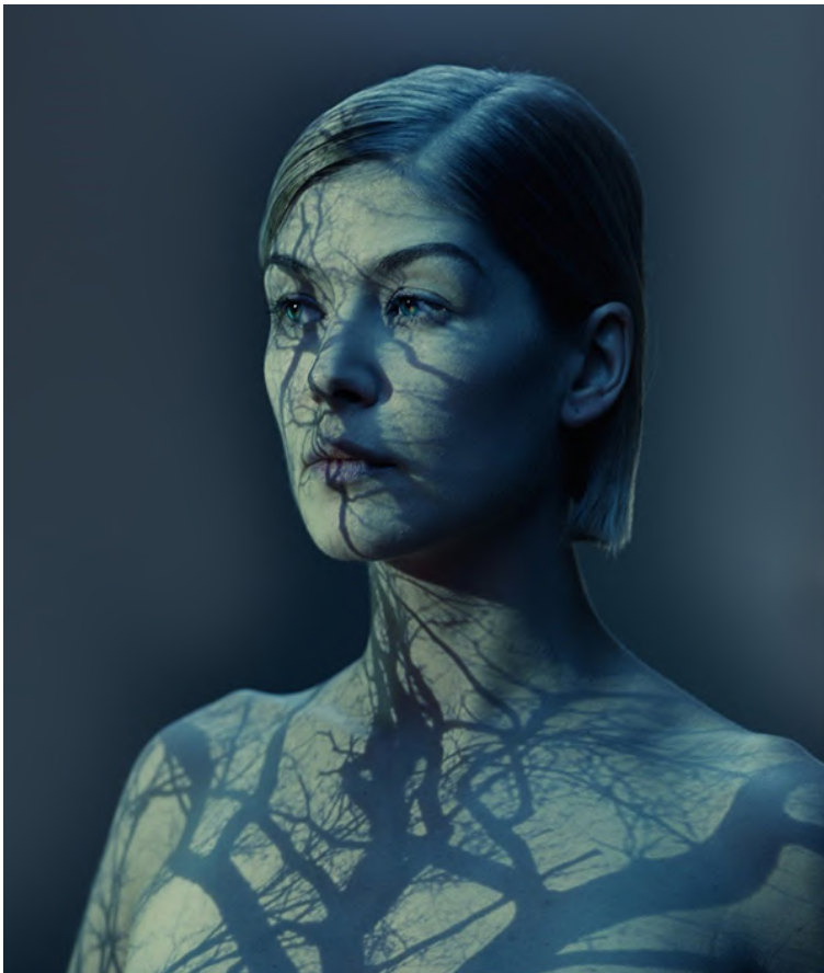
Rosamund Pike II, Los Angeles, USA, 2014

Nadav Kander est représenté par la Flowers Gallery, à Londres, Howard Greenberg Gallery à New York.