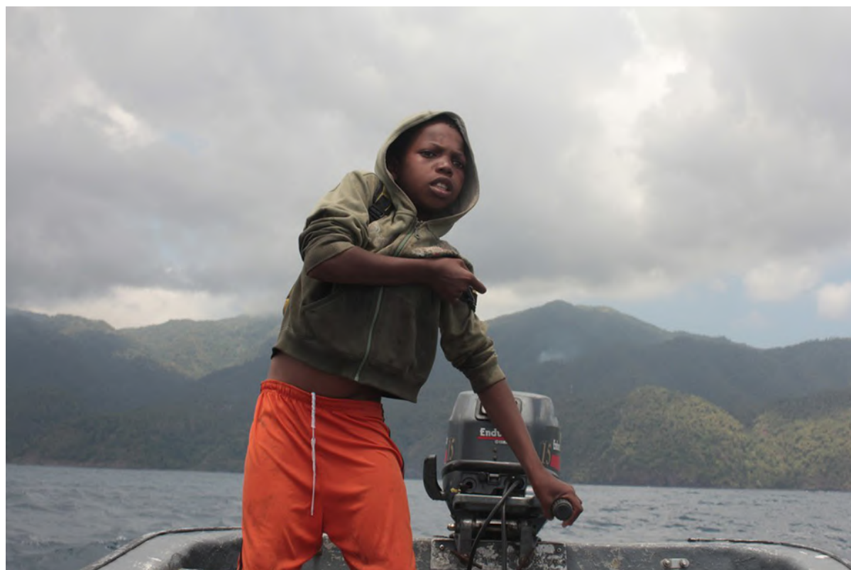
Sans titre, La Réunion. Série La Cinquième île