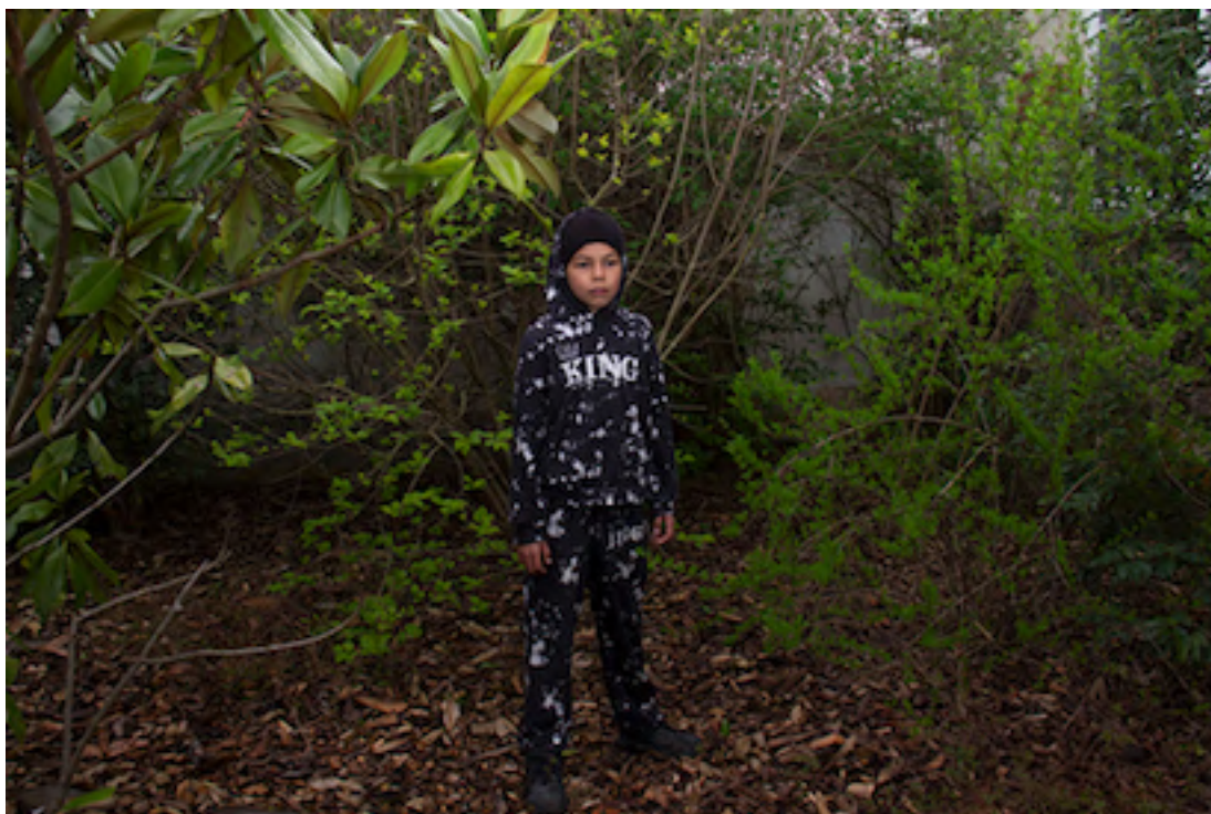
Portrait(s) s'invite à l'école - Ecole Paul Bert, 2024

Cet atelier est rendu possible par les actions conjointes des instituteurs de l'école élémentaire Paul Bert et de la Ville de Vichy.