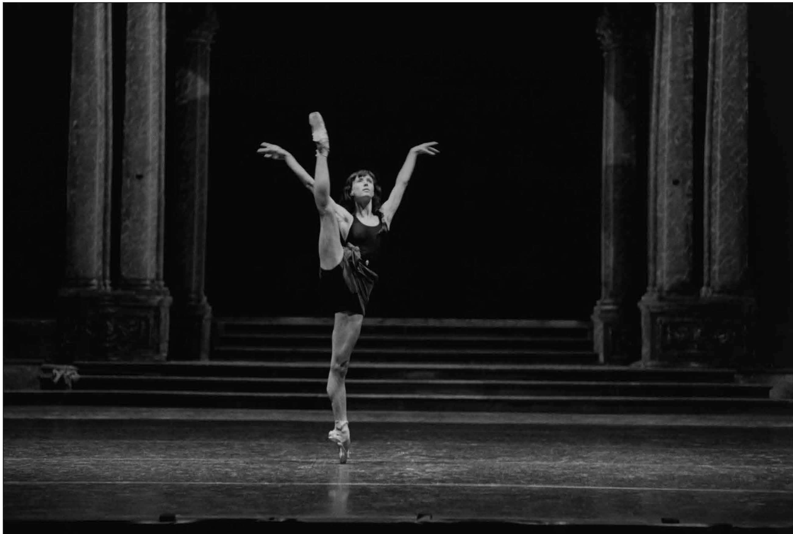
Sylvie Guillem, répétition de La belle au bois dormant, Londres, 1996