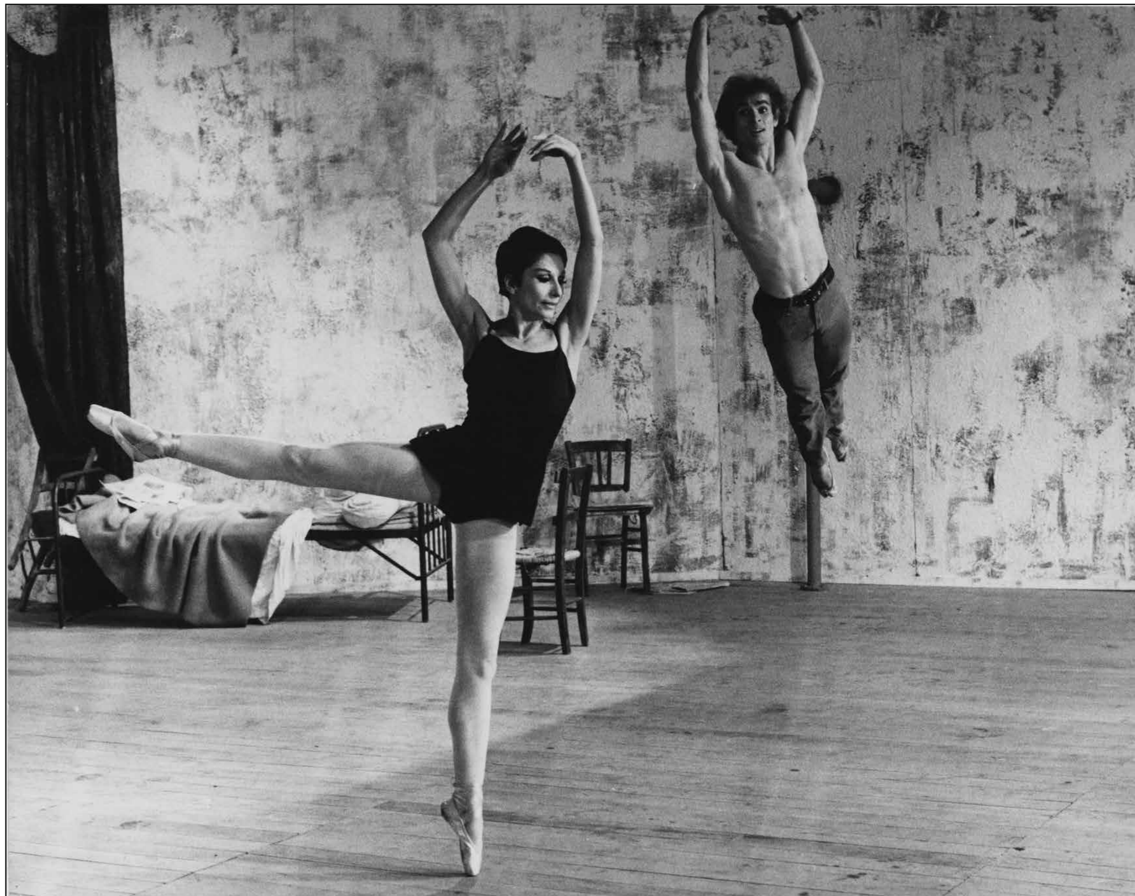
Zizi Jeanmaire et Rudolf Noureev, "Le jeune homme et la mort", Roland Petit, Paris, 1966