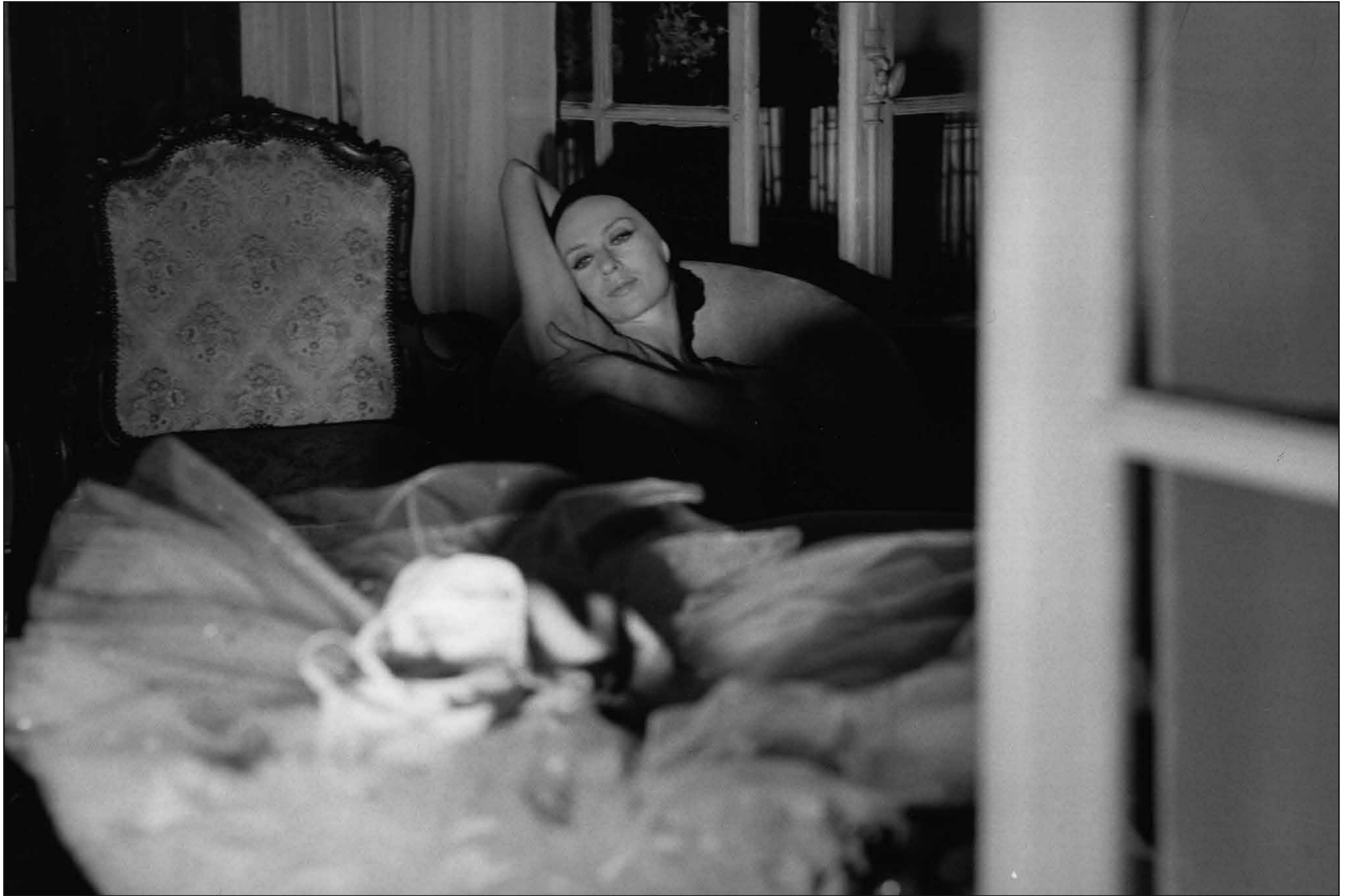
FRANÇOIS GRAGNON Tessa Beaumont, Paris, 1969