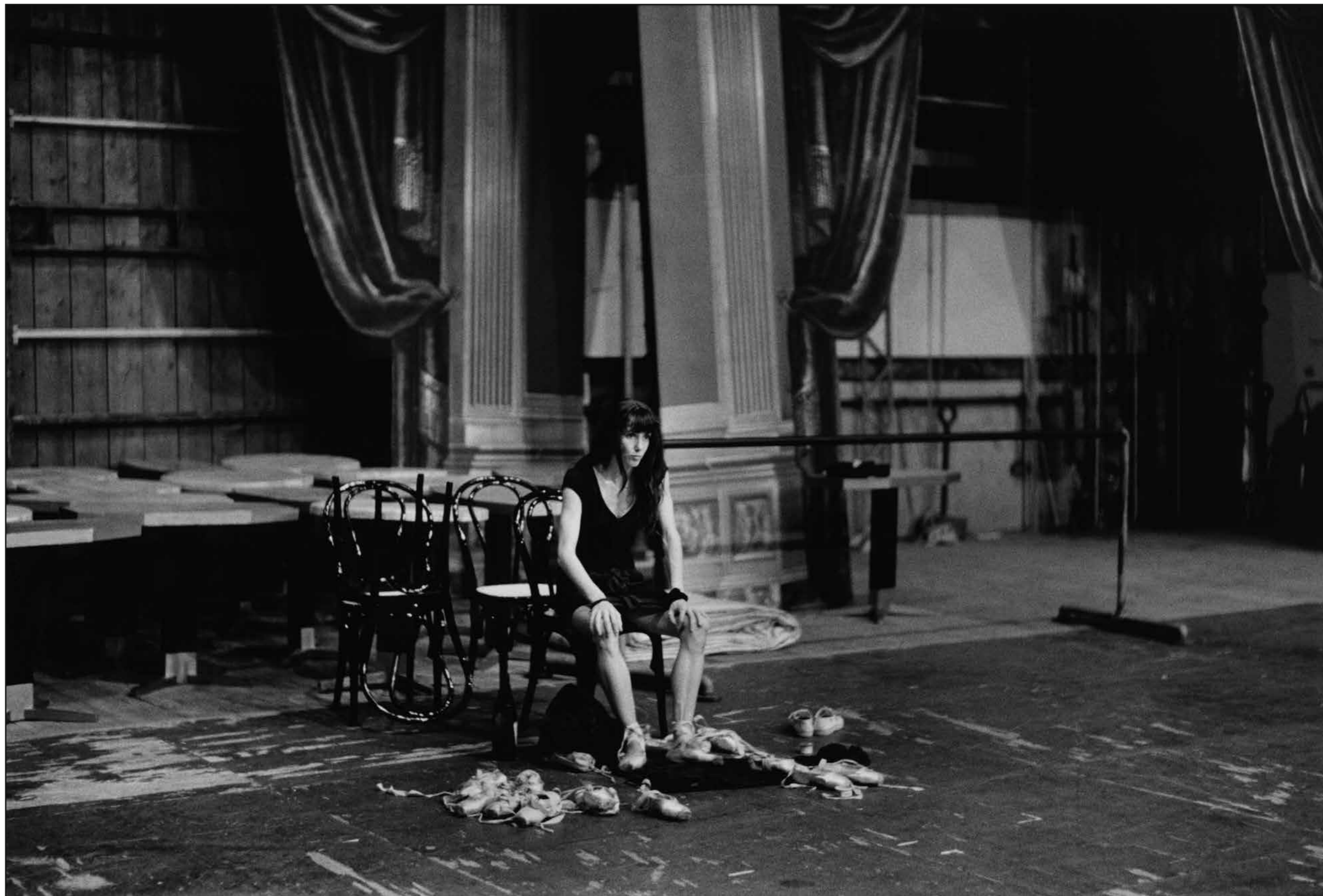
GILLES TAPIE Sylvie Guillem, Palerme, 1995