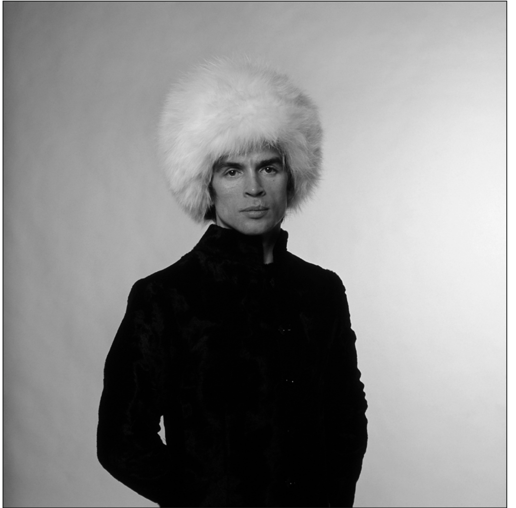
ANDRÉ CARRARA Rudolf Nureev, Londres, 1966

(©ANDRE CARRARA - LA GALERIE DE L'INSTANT)