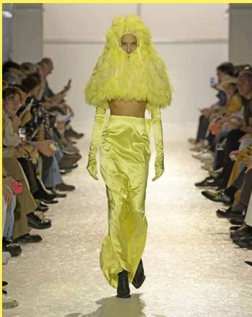
Portrait, Luc Bertrand Photographie du défilé : Arnel de la Gente