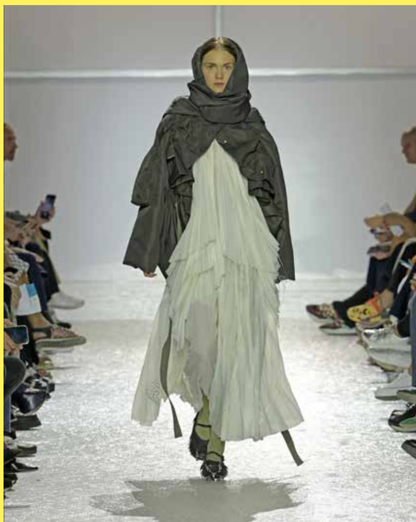
Portrait, Luc Bertrand Photographie du défilé : Arnel de la Gente