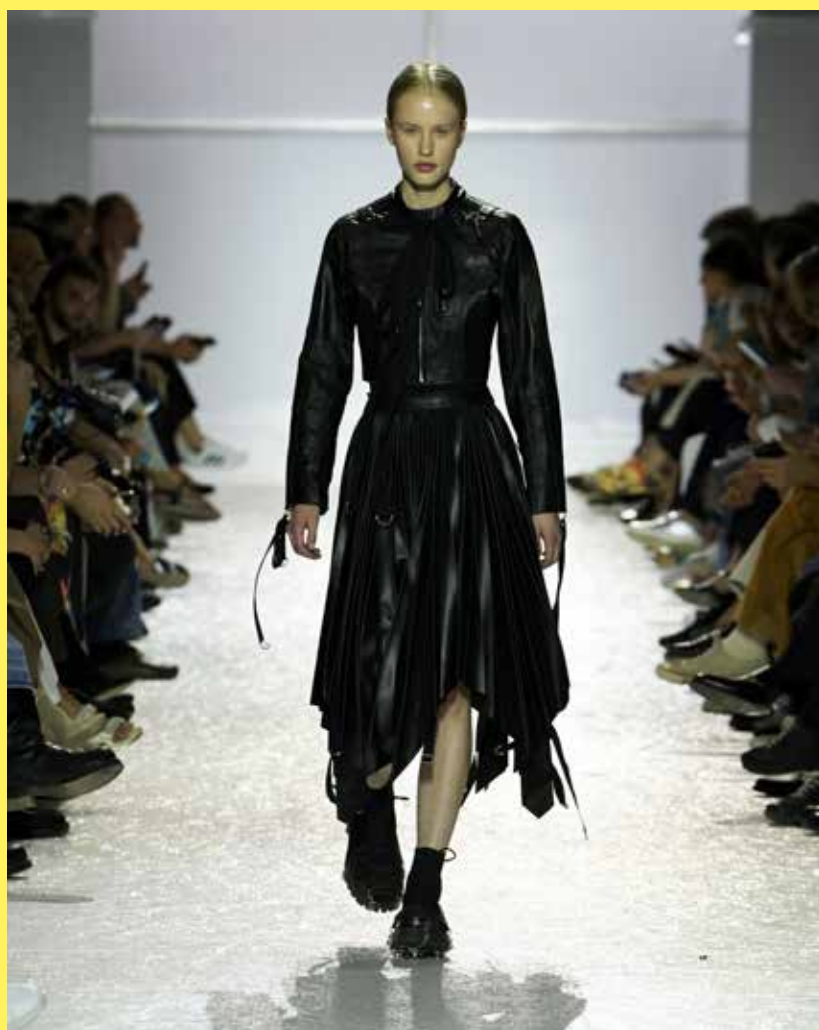
Portrait, Luc Bertrand Photographie du défilé : Arnel de la Gente