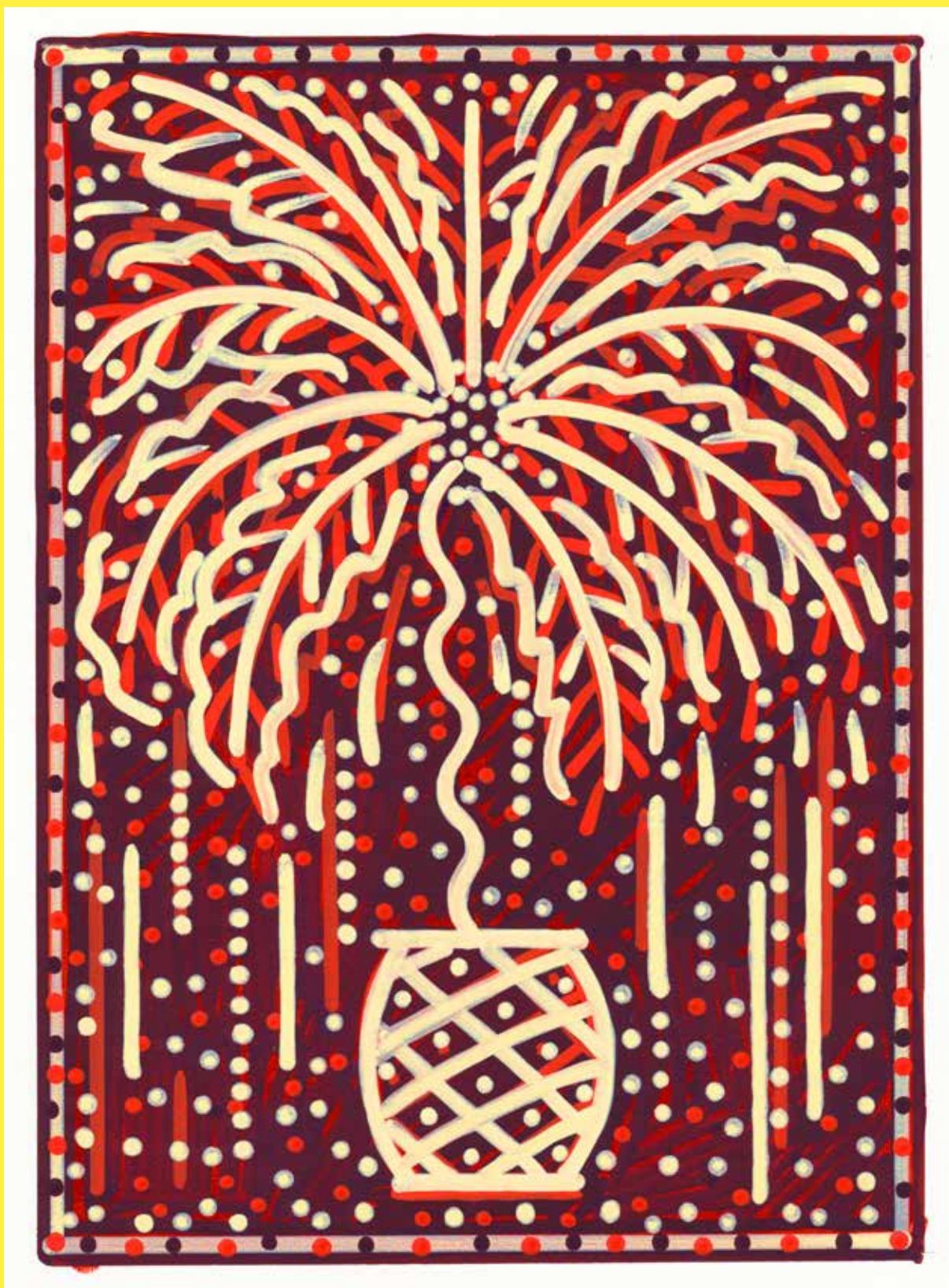
Hugo Capron, 'Fou d'artifice' (palmer II) acrylique sur papier, 23x16,5cm, 2023

ILLUSTRATION PAR HUGO CAPRON DES TROPHÉES DES LAURÉATS RÉALISÉS PAR DESRUES.