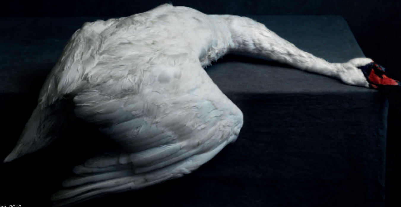
Cygne , 2016