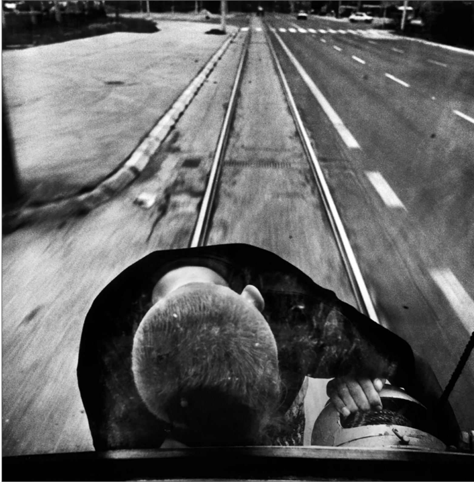
Un garçon accroché à l'arrière d'un tramway. Sarajevo, Bosnie-Herzégovine, 1996.