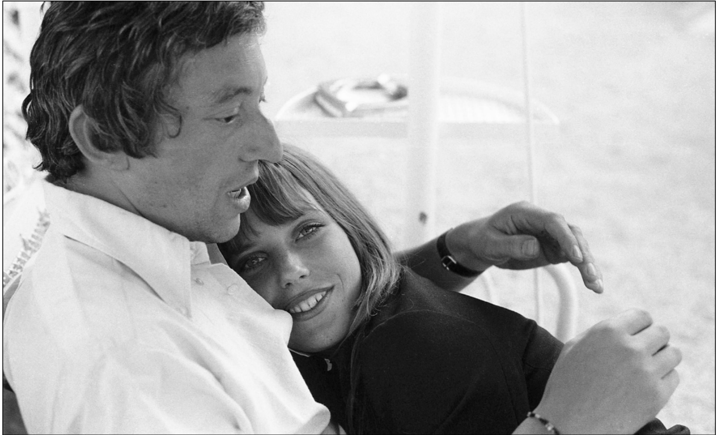
Serge Gainsbourg et Jane Birkin, Cannes, 1969