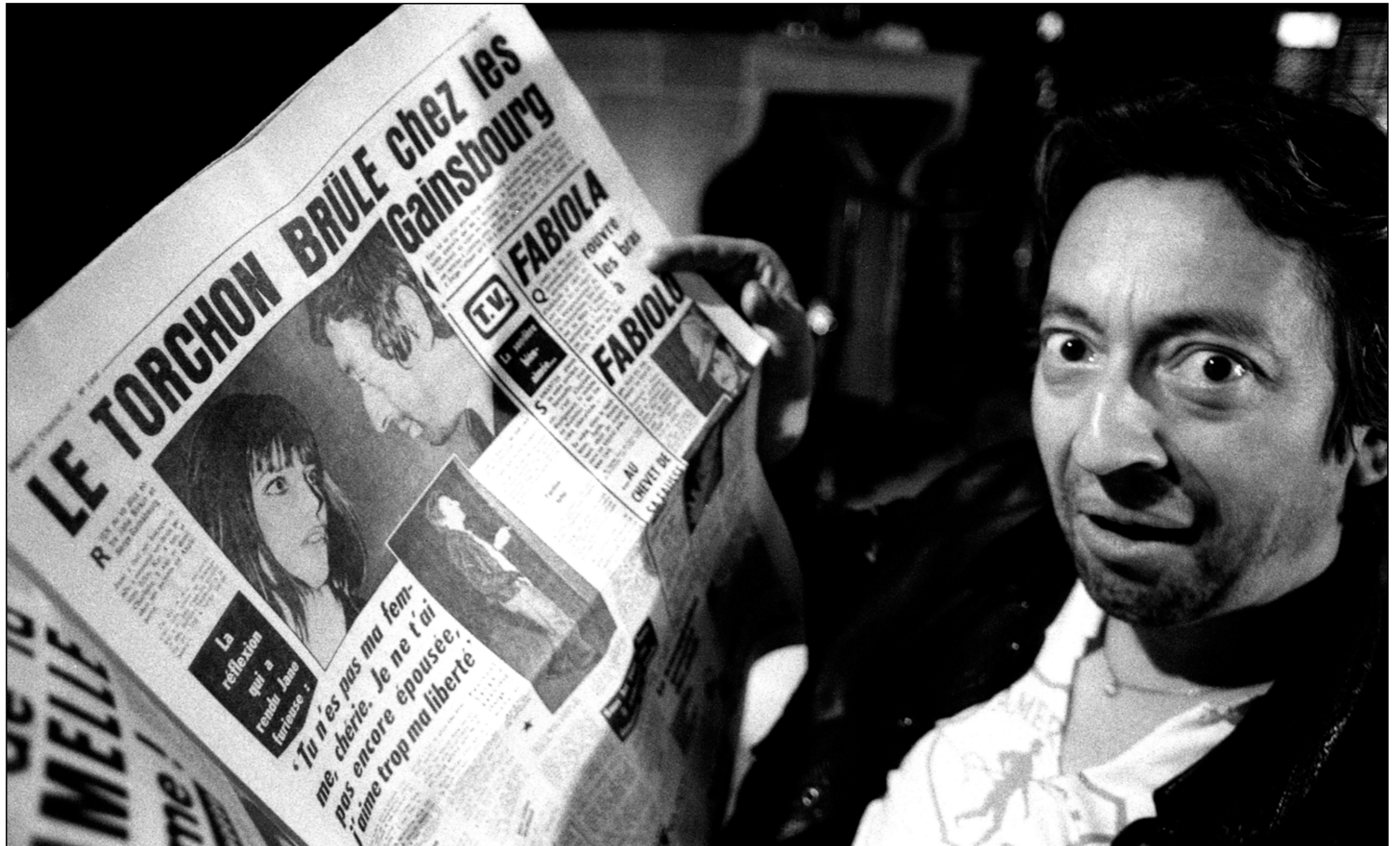
Serge Gainsbourg, Paris, 1974