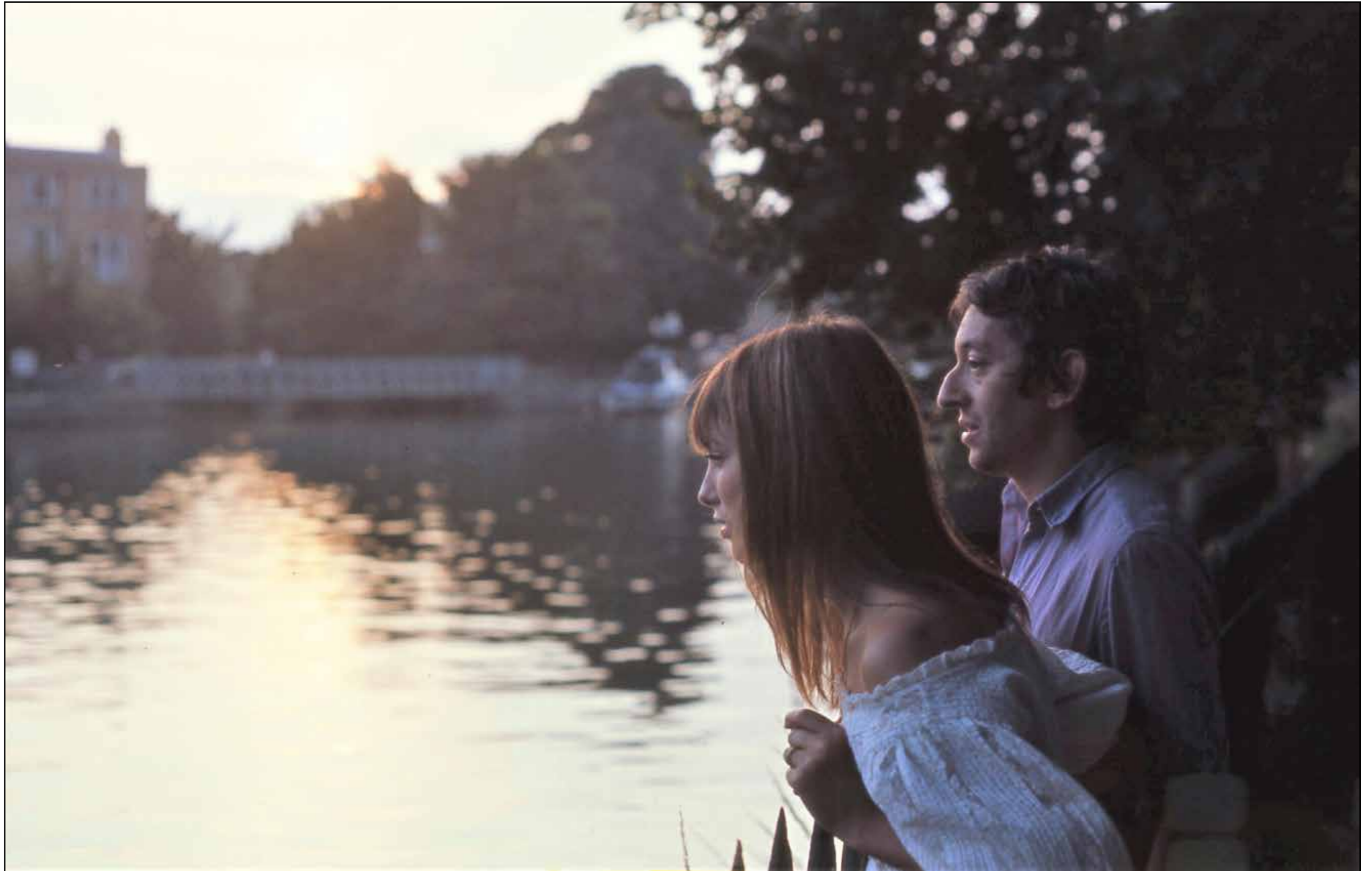
Serge Gainsbourg et Jane Birkin, Oxford, 1969