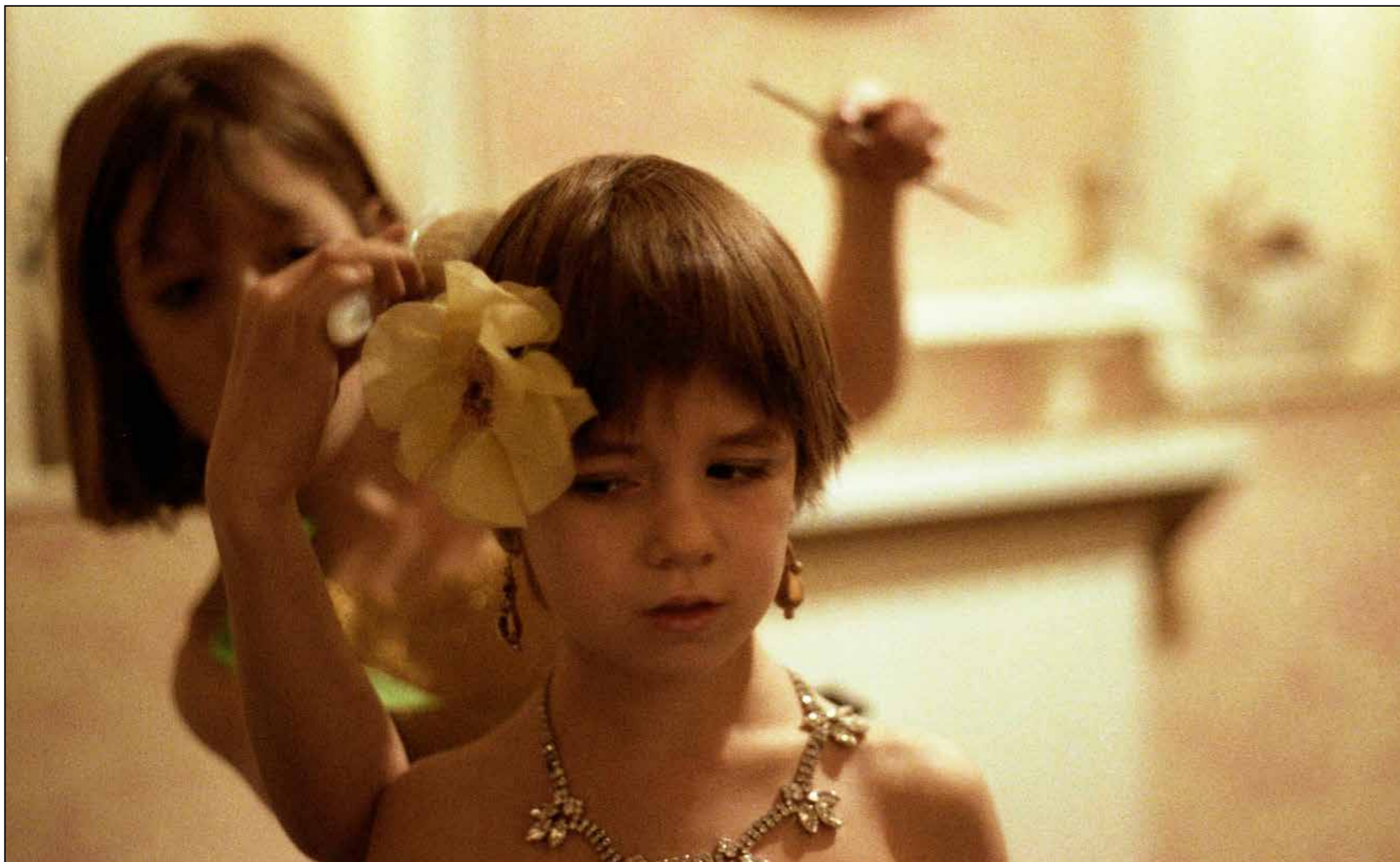
Cate Barry et Charlotte Gainsbourg, 1977