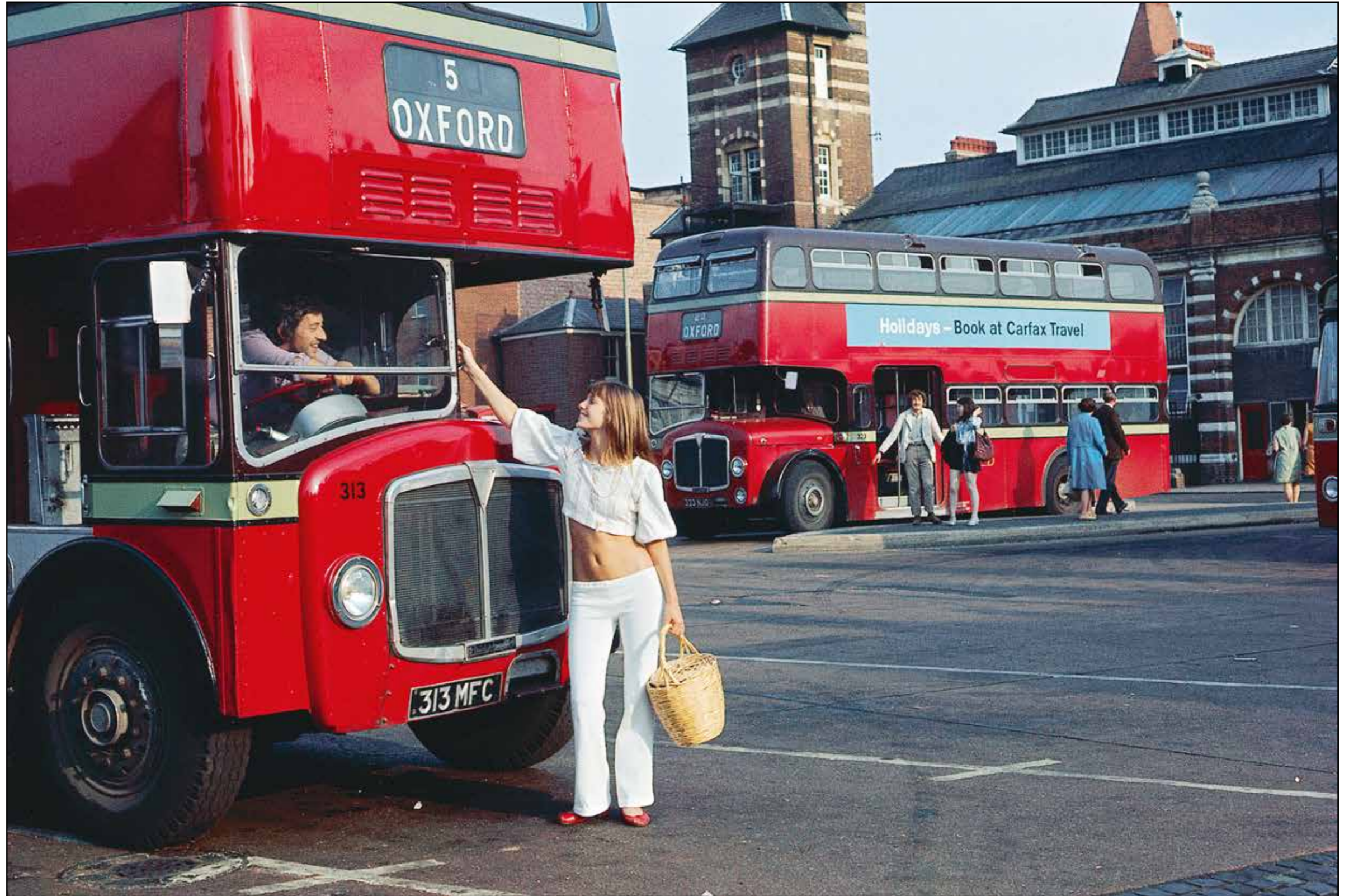
Serge Gainsbourg et Jane Birkin, Oxford, 1969