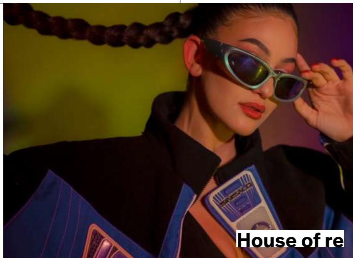
House of re

À l'occasion de ses 150 ans, la BOCI a sélectionné une trentaine de bijoux de créateurs emblématiques de ces années débridées et créatives. Bien plus qu'un témoin de l'essor du bijou entre 1960 et 1990, le salon Bijorhca en a été l'un des principaux vecteurs à l'échelle européenne et mondiale.