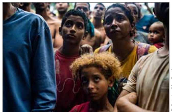
Lauréat du Visa d'or humanitaire du Comité International de la Croix-Rouge (CICR) 2023