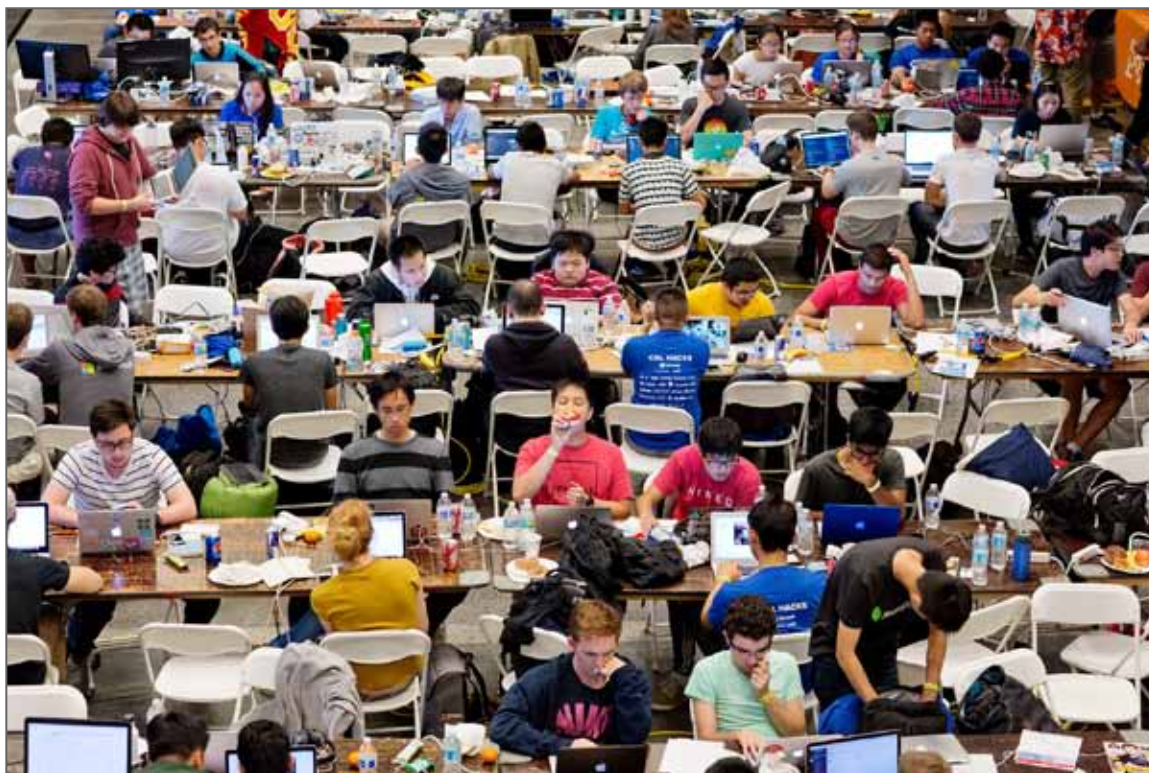
Lauréate du Prix Pierre & Alexandra Boulat 2022

Les photos prises en 2022 et 2023 ont reçu le soutien du Prix Pierre & Alexandra Boulat. Certaines étapes précédentes ont bénéficié du soutien du Fonds d'urgence de la Fondation Magnum