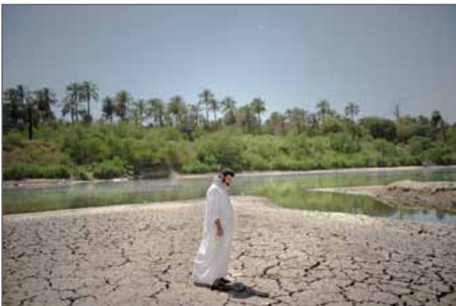
© Emily Garthwaite / Institute Lauréate du Visa d'or de la Ville de Perpignan Rémi Ochlik 2023

Emily Garthwaite / Institute est la lauréate 2023 pour son travail en Irak « Didjla : voyage le long du Tigre ».