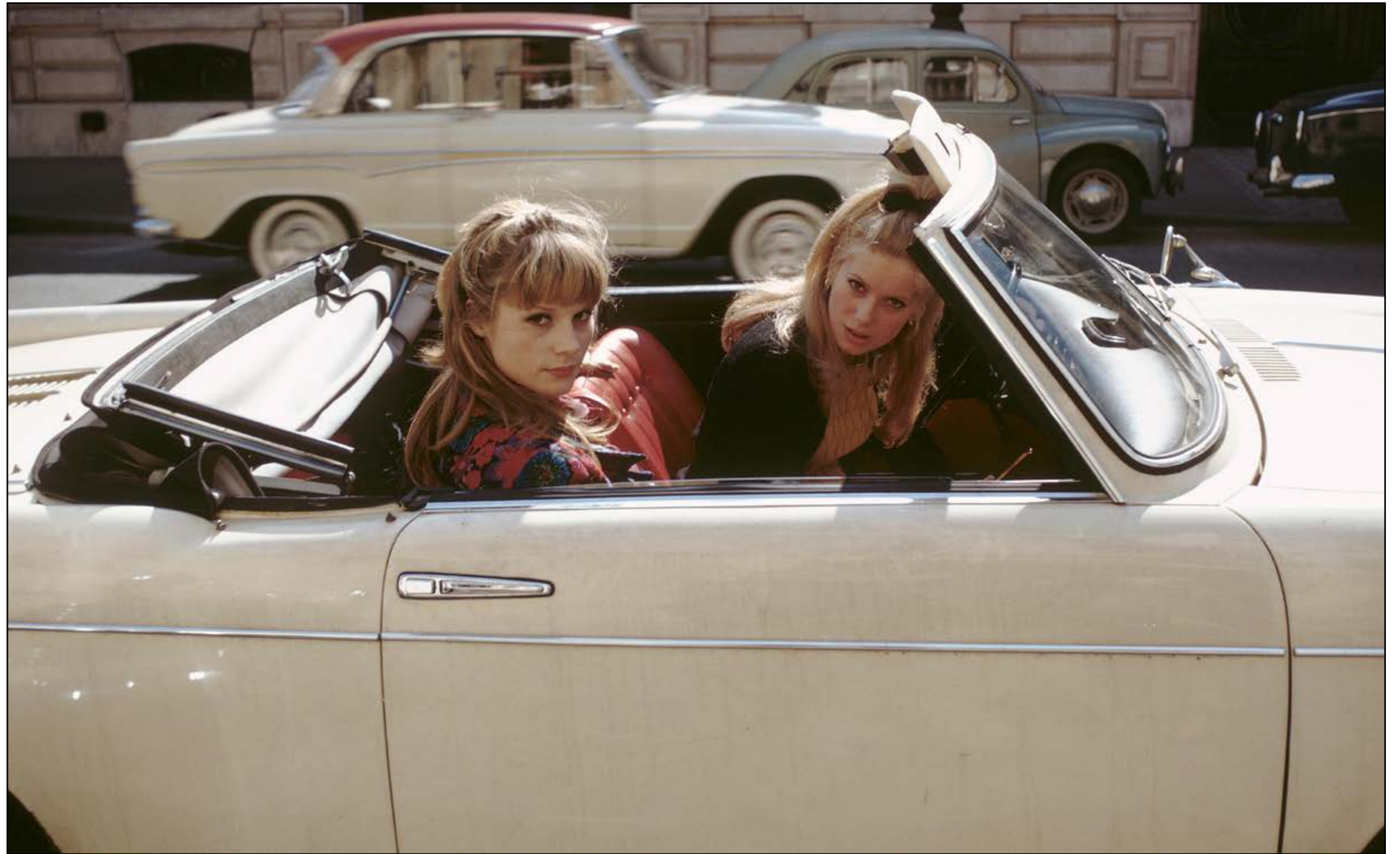
FRANÇOIS GRAGNON avec Françoise Dorléac, 1964