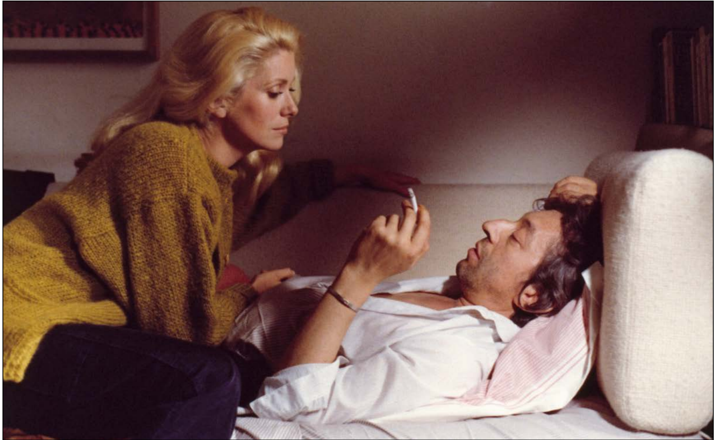
GEORGES PIERRE avec Serge Gainsbourg sur le tournage de «Je vous aime» de Claude Berri, 1980