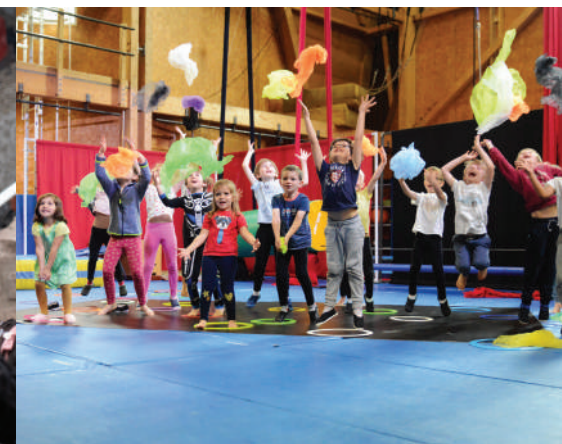
© Rosane Ntyam, Irvin Anneix, Héléne Combat-Weiss, Camille Kirmidis