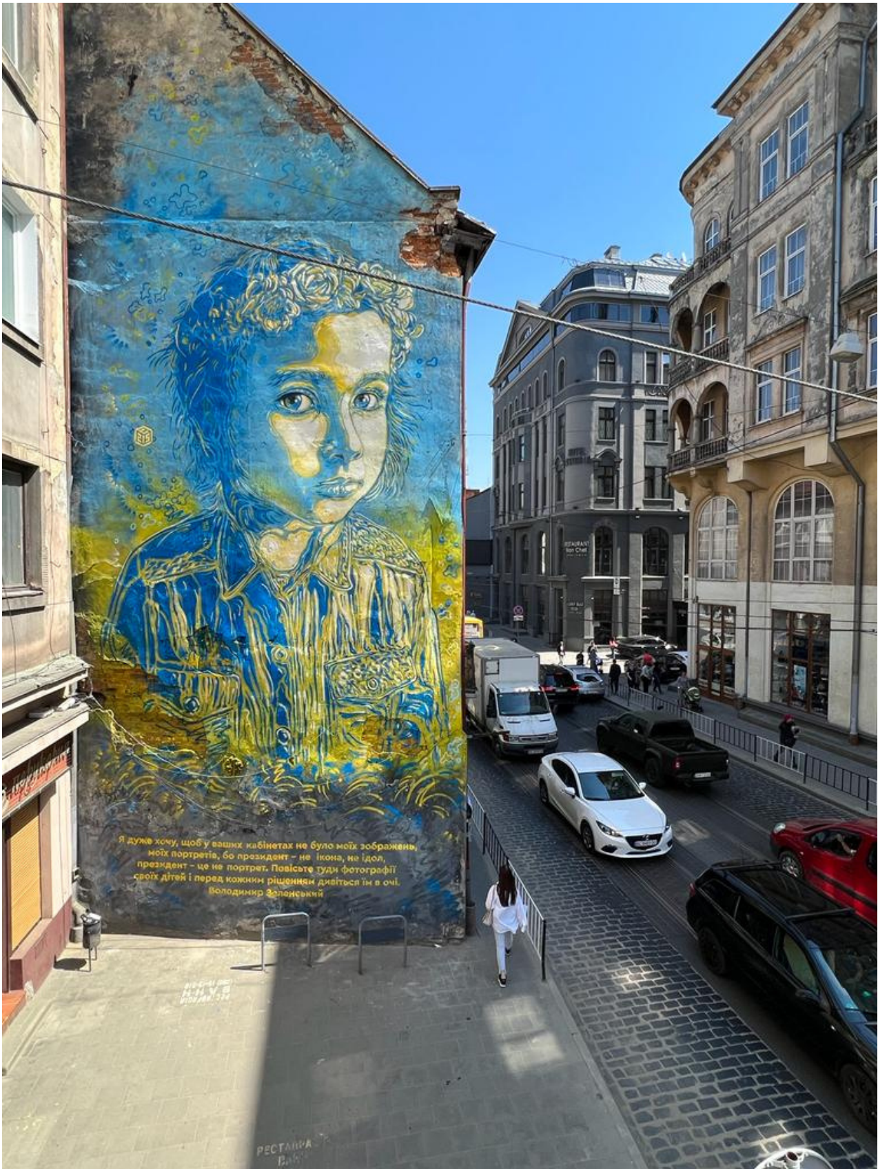
Fresque peinte à Lviv en partenariat avec la mairie les 11 et 12 mai 2022.