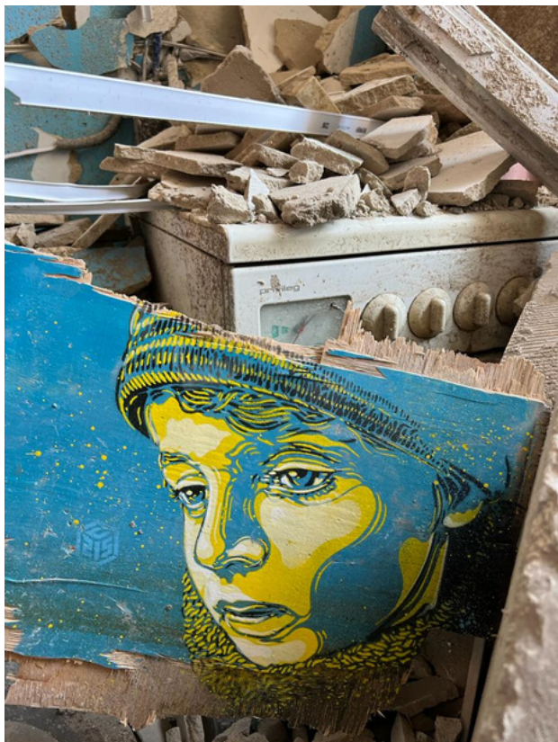
Portrait de l'enfant d'une amie de l'artiste peint à Jytomyr dans les décombres d'un bâtiment civil détruit par les bombardements en mars 2022.

« Parce que l'art est parfois seul capable d'exprimer l'indicible, j'ai choisi d'exposer à l'Assemblée nationale les photographies du travail de C215 en Ukraine, dont chacune capture en une même image le pire et le meilleur de l'humanité », explique Yaël Braun-Pivet, Présidente de l'Assemblée Nationale.