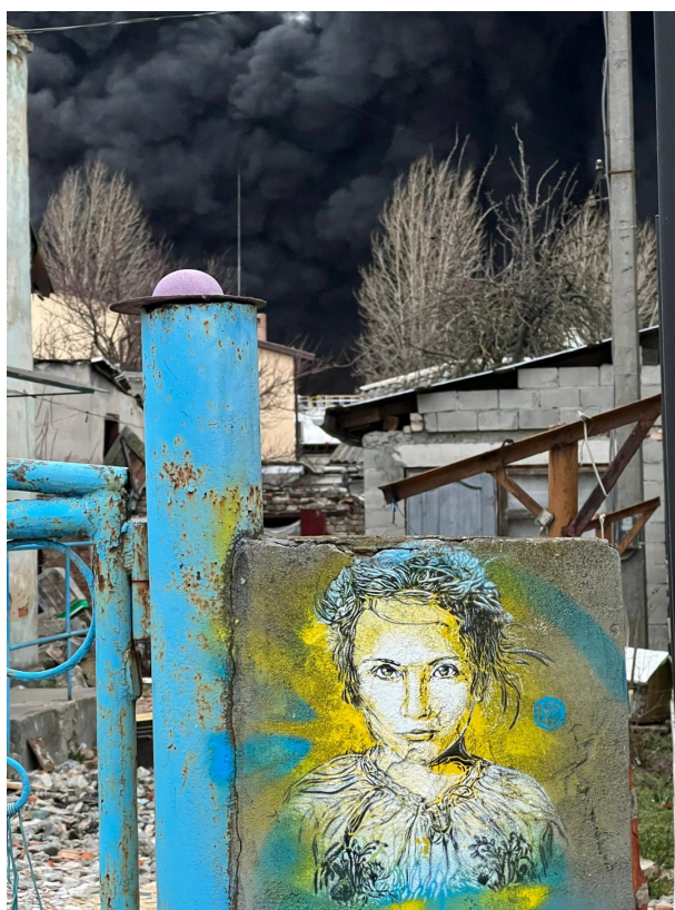
Le 26 mars 2022 à 18 heures, un missile frappe la ville de Lviv, à quelques centaines de mètres de l'endroit où C215 a peint cette première œuvre représentant une enfant ukrainienne, d'après une photo de Mark Neville.

Cette première œuvre peinte sur le territoire interpelle les autorités qui lui permettent, alors, de rejoindre Jytomyr, au sud de la frontière bélarusse. Accueilli par la résistance ukrainienne, il peint des portraits d'enfants dans un immeuble partiellement détruit, qui avait été évacué par ses occupants. Il poursuit ensuite sa route jusqu'à Kyïv, assiégée, où il réalise différentes œuvres sur du mobilier urbain marqué par les combats.