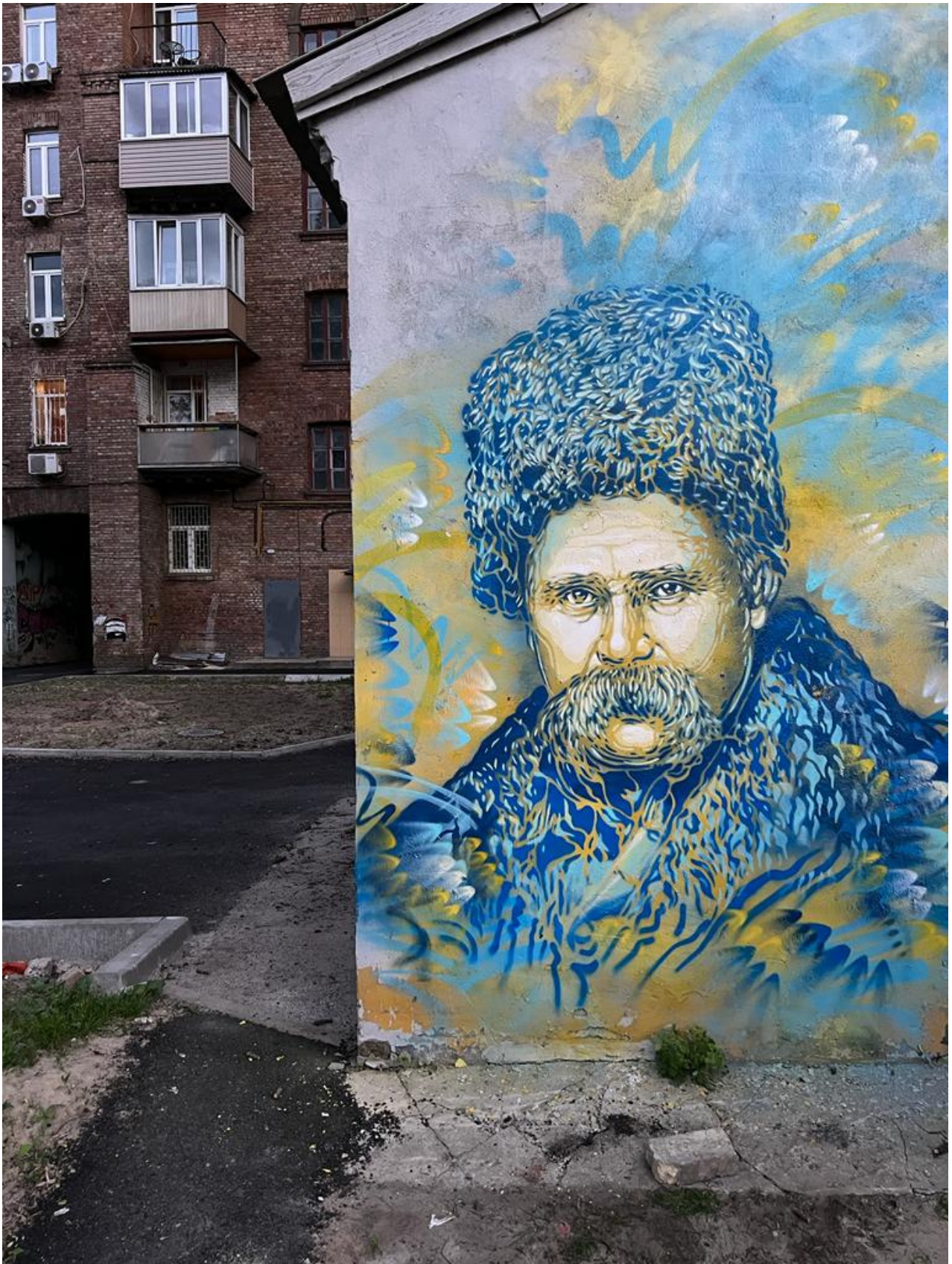
Portrait de Taras Chevtchenko peint à Kyïv en mai 2022.