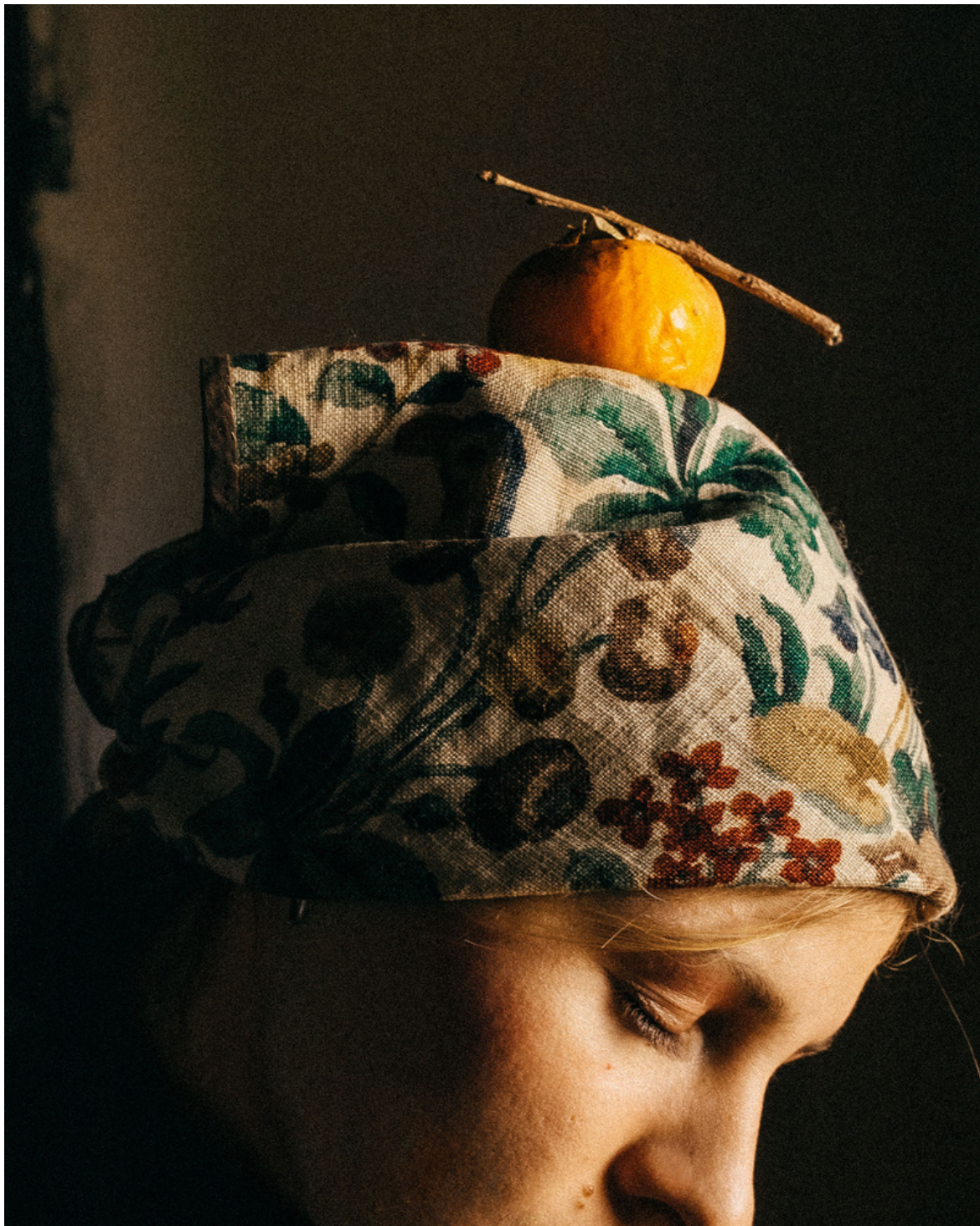
Chloé et kaki, Torre Pellice 2020. Série « Insolations »

Antoine Henault vit à Paris. Il collabore régulièrement avec la mode, la presse et la musique et sort lauréat du Troisième Prix - Dotation Filippo Roversi 2022 du Prix Picto de la Photographie de Mode.