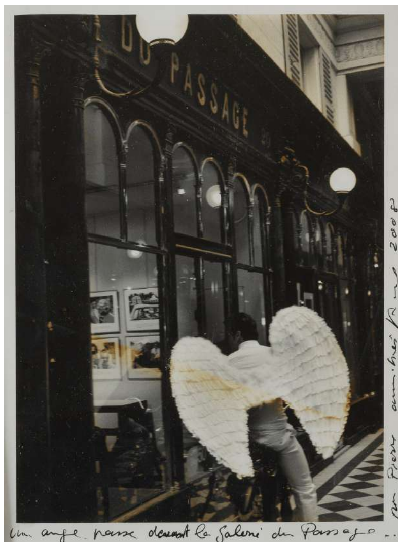
Karl Lagerfeld (1933-2019), Un ange passe devant la Galerie du Passage , tirage argentique, 24 x 17 cm.

OBSESSION MASCULIN met en lumière une sélection forte, engagée et parfois controversée, de nus masculins issus de sa collection privée : peintures, sculptures, photographies, céramiques et dessins, défiant les tabous entourant l'érotisme masculin, invitent le visiteur à réévaluer la notion d'identité masculine et les vues normatives du corps humain.