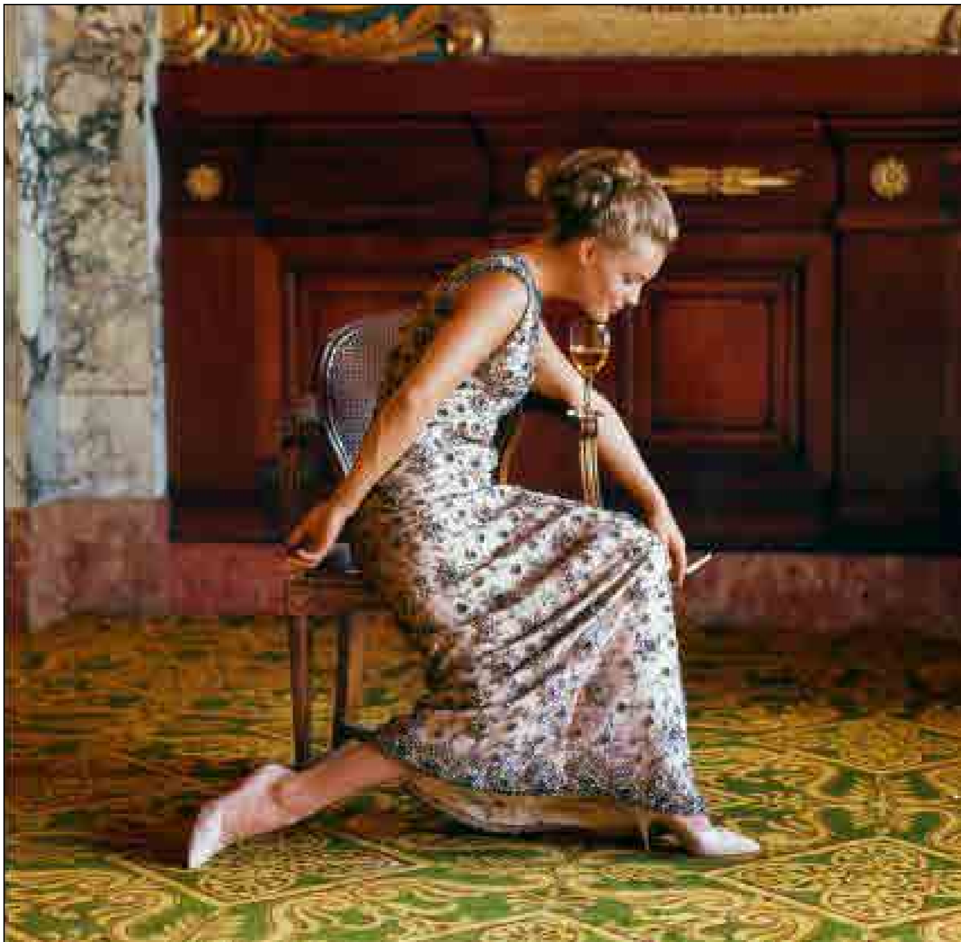
MILTON H. GREENE, HÔTEL DE PARIS, MONTE CARLO, 1963