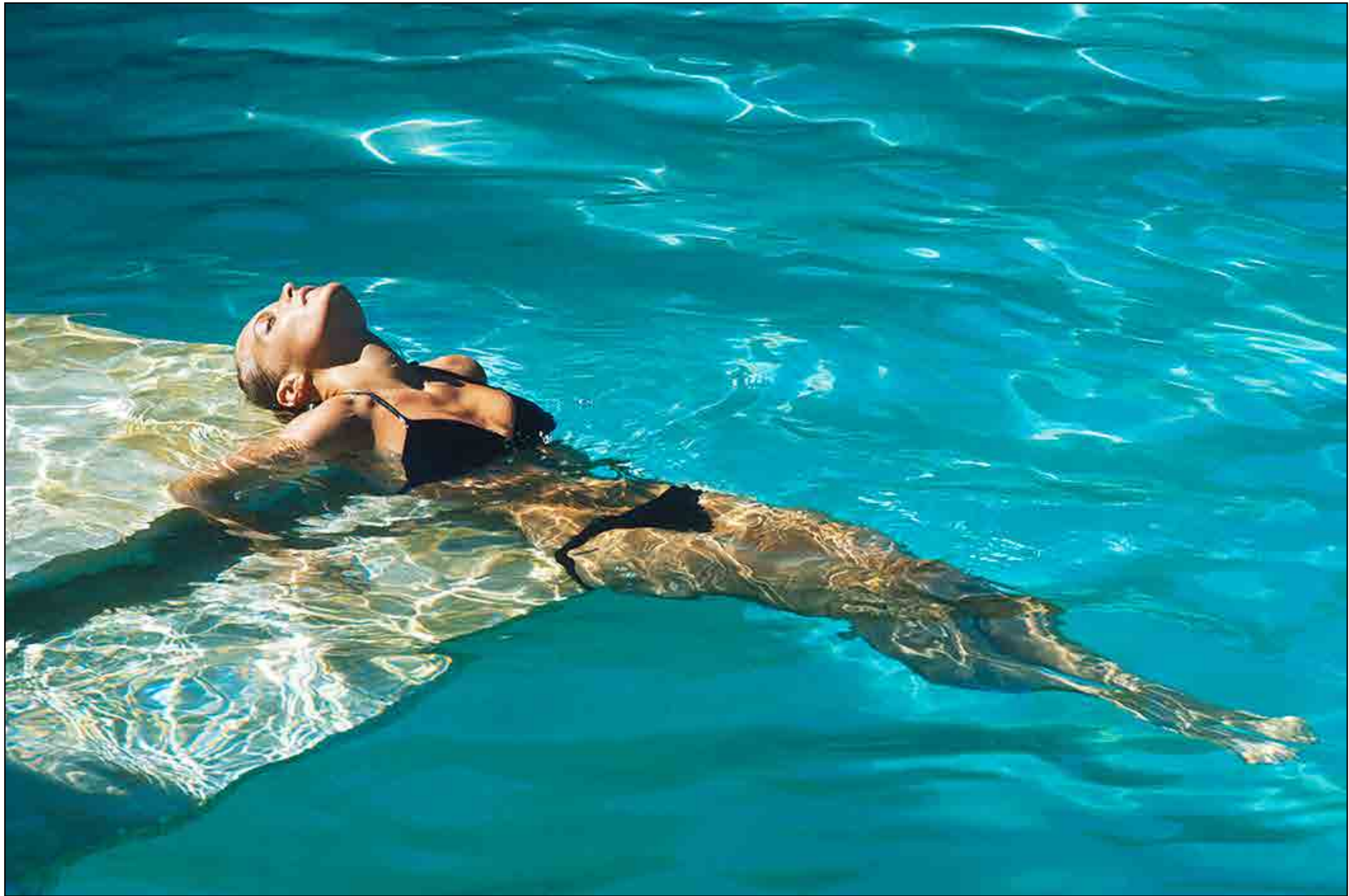
PHILIPPE LE TELLIER, SUR LE TOURNAGE DE LA PISCINE DE JACQUES DERAY, 1968