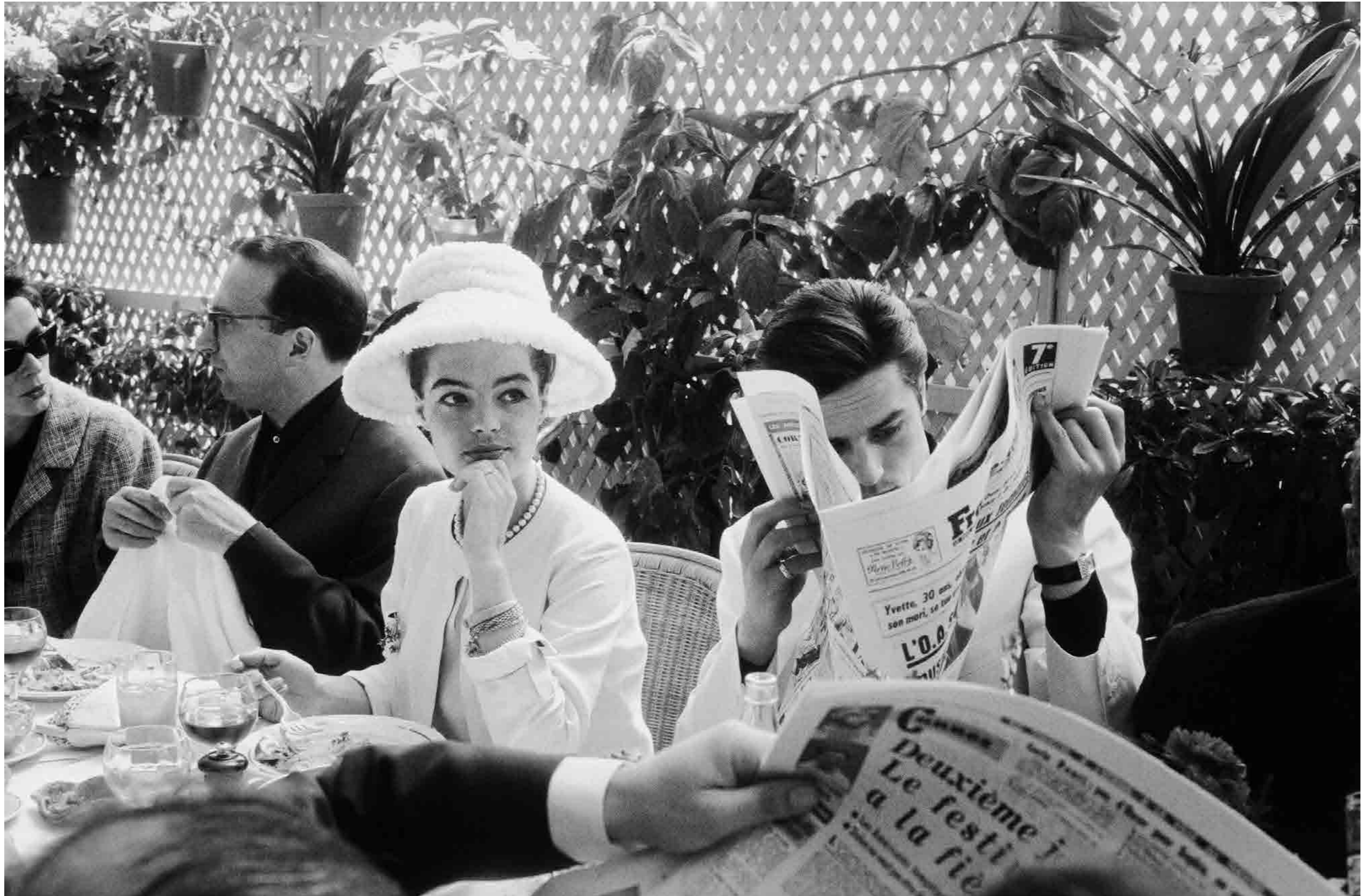
FRANÇOIS GRAGNON, CANNES, 1962