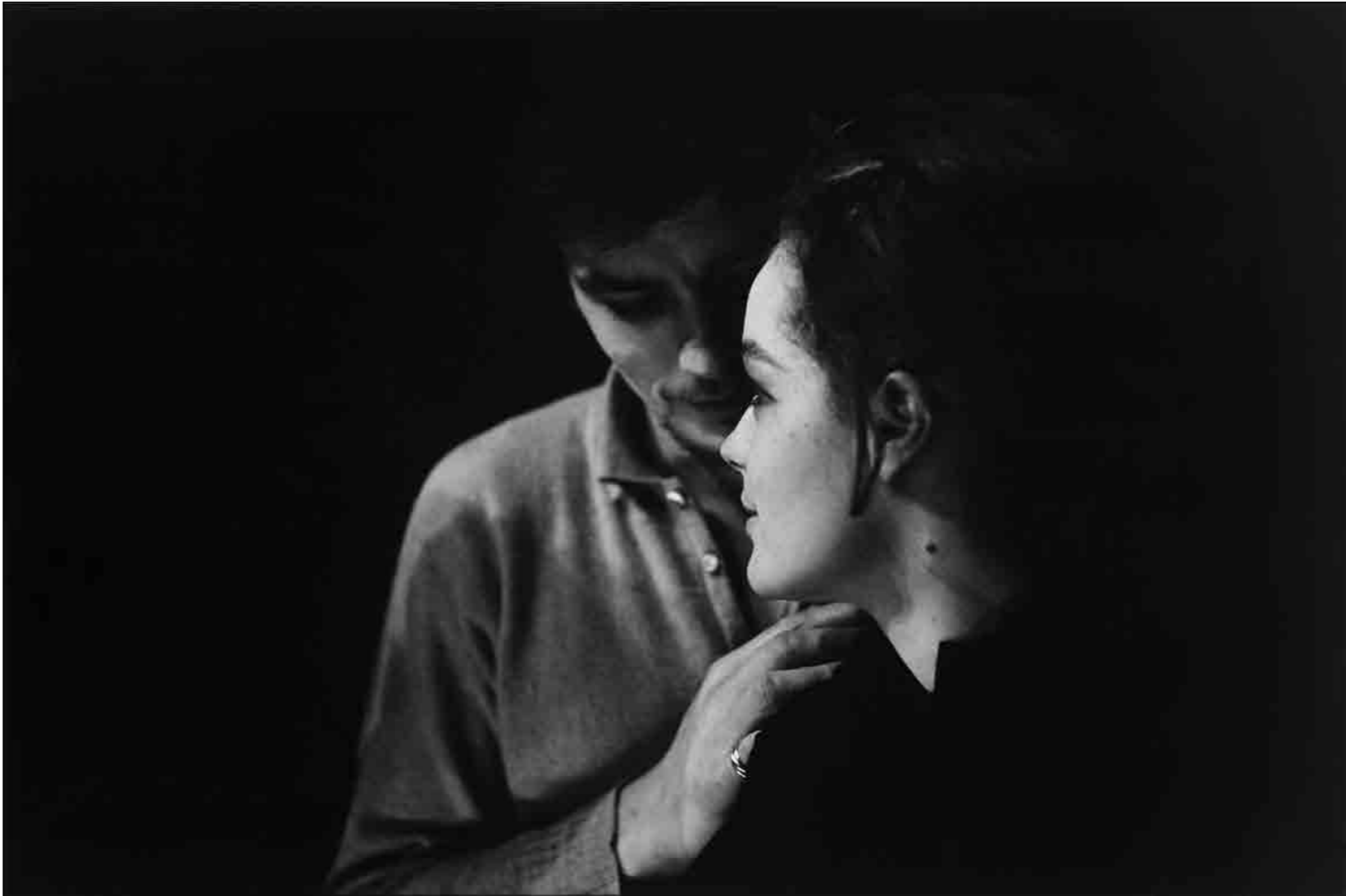
ALAIN DELON VENU EMBRASSER ROMY SCHNEIDER LORS DES RÉPÉTITIONS DE LA MOUETTE MISE EN SCÈNE PAR SACHA PITOËFF, 1961