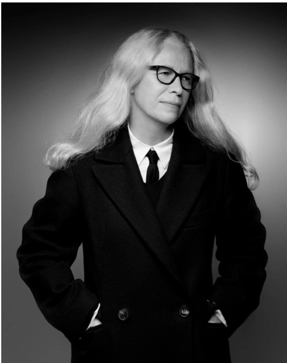
Dominique Issermann par Karl Lagerfeld