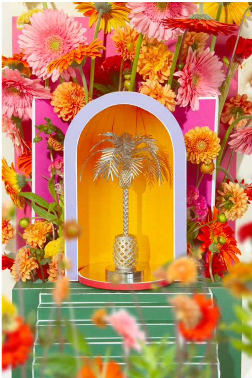
Photographie Marie Rime, 2021

LES TROPHÉES DES LAURÉATS DES PRIX MODE, ACCESSOIRES DE MODE ET PHOTOGRAPHIE SONT RÉALISÉS PAR DESRUES.