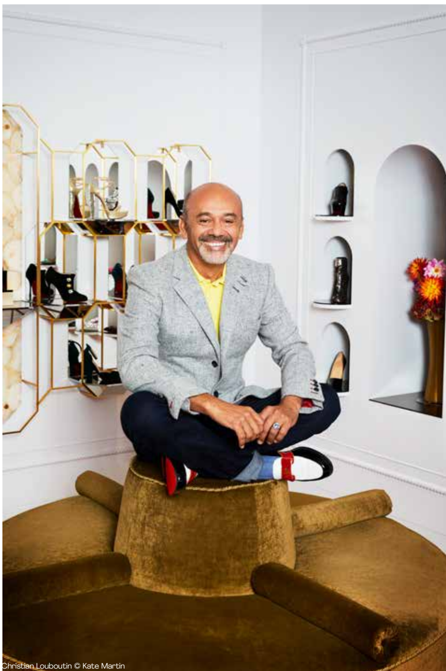
Christian Louboutin