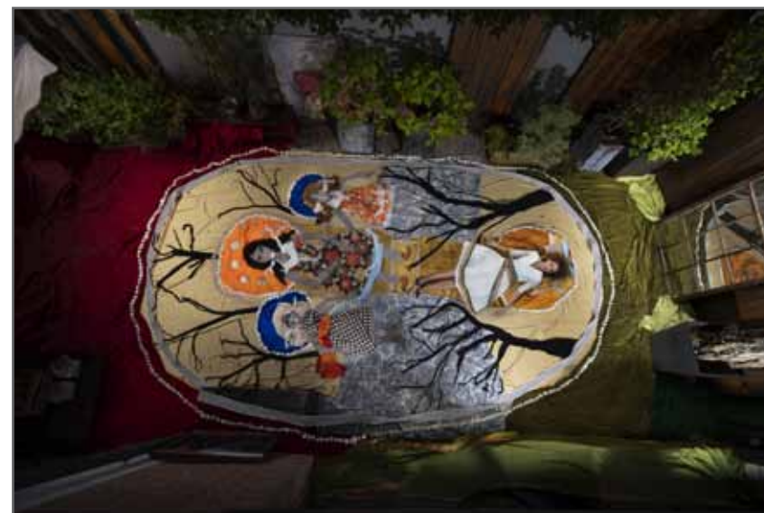
Leila Slimani

Une mise en scène de l'imaginaire qui émerge dans le quotidien, comme le moment du livre ouvert : le lien entre son travail et celui des bénévoles a été évident pour tous.