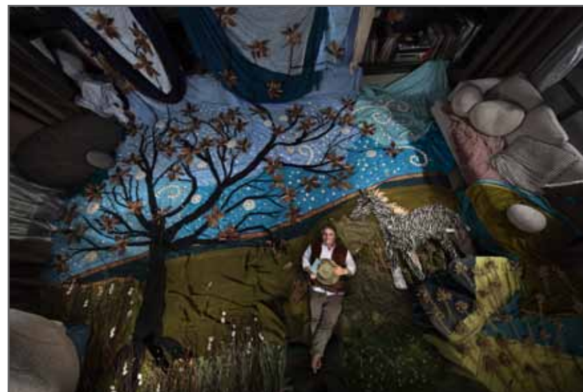
Alexandre Jardin