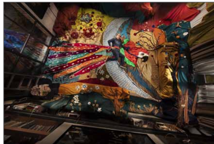
François Morel