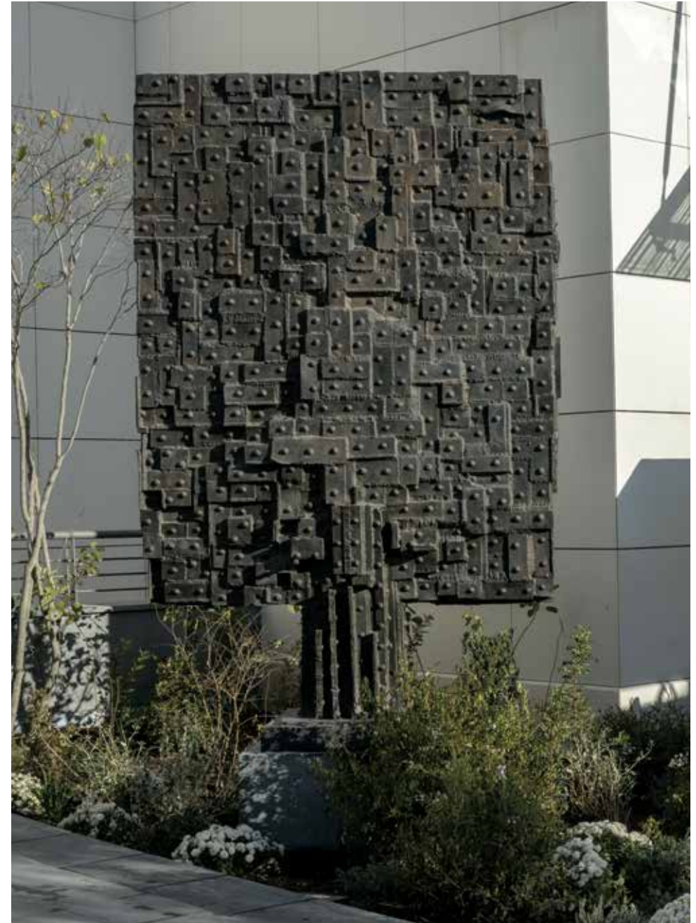
Hommage à Eiffel , 1991 Bronze soudé, 350 x 210 x 78 cm

Célèbre sculpteur français, César a fait partie des membres des Nouveaux Réalistes, mouvement né en 1960. Usant de tous les matériaux pour exprimer son art : acier, marbre, cartons, tissus, bijoux, montres, boîtes d'emballage, plexiglas, polyester, polyuréthane, bronze..., César a développé une œuvre reposant sur un profond respect dans la matière, à travers une juxtaposition de différents langages. Ses « compressions », comme actes de défit à la société de consommation, et à l'inverse ses « expansions » de coulées lisses et dures, ou encore son Pouce (empreinte agrandie de son propre pouce), sont devenues des œuvres emblématiques invitant à regarder différemment les objets du quotidien. L'œuvre Hommage à Eiffel qui prend place à Polygone Riviera est une réédition d'une œuvre antérieure, réalisée par César en 1983 : une sculpture monumentale, plaque de bronze de 18 mètres de haut et de 500 tonnes créée à partir de poutrelles issues de l'opération d'allègement de la Tour Eiffel. Animée d'anfractuosités et de hauts reliefs, cette œuvre marque un parti-pris d'abstraction pour lequel seul compte la plasticité du matériau. Les plaques métalliques se succèdent et s'imbriquent pour former une surface comme un labyrinthe, au « format tableau », dans laquelle le regard se perd.