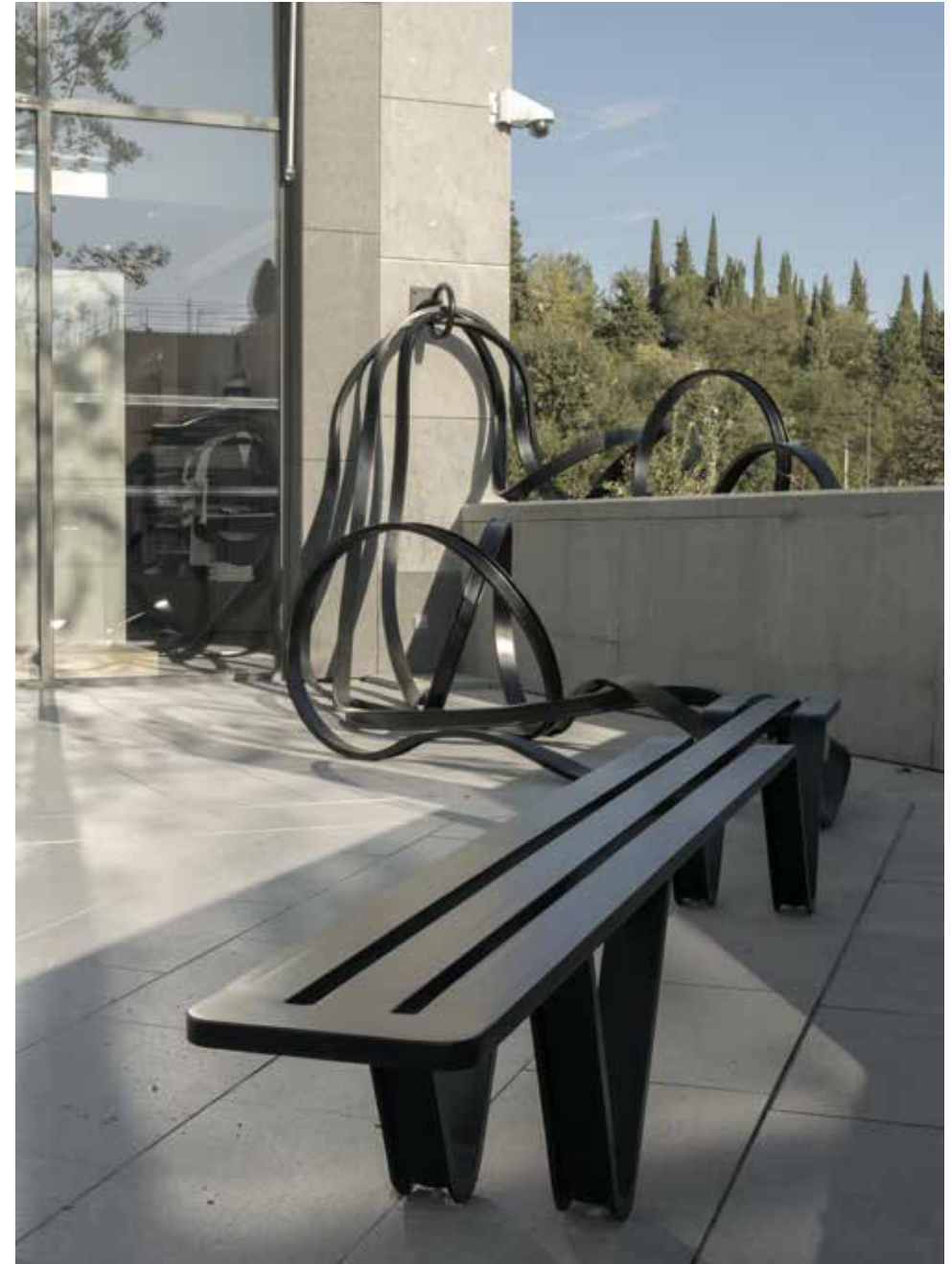
Banc d'amarrage , 2015 Acier peint, 1230 x 380 x 225 cm

Arabesques d'acier, volutes de bois ou assises en marbre, les œuvres de Pablo Reinoso entre sculpture et design s'affranchissent de leur forme d'usage initiale pour bouleverser notre environnement et le faire entrer dans une nouvelle dimension. Fin écho à l'art minimal, les sculptures de Pablo Reinoso se jouent de la rigidité des objets usuels pour leur donner une soudaine expansion, métaphore d'une croissance végétale inéluctable, même dans l'espace urbain. Elles se déploient telles des corps incarnés, mouvants, impermanents, qui ne sauraient se limiter à une fonction. Dans une logique d'extension et de déploiement des matériaux, ses œuvres Banc d'amarrage et Twin Bench se développent dans l'espace telles des lianes animées du souffle d'une respiration. En dialogue avec l'environnement, ses sculptures-bancs insolites s'épanouissent dans un jeu de forme avec les jardinières du site, tissant des liens entre les corps et la nature.