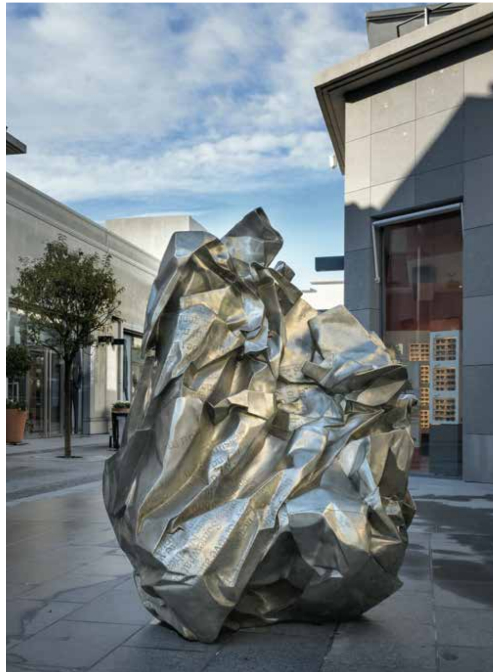
China Daily - Top 10 Profiles Of The Urban Male , 2007 Bronze blanc, 190 x 166 cm

Wang Du utilise les modes de communication de la presse comme un langage commun dont la figuration devient une des conséquences logiques de l'ère de la reproduction de l'image. Selon lui, les médias constituent une « post-réalité » où se confondent monde réel et monde créé par les médias. Ainsi, ses sculptures et installations, parfois monumentales, interrogent le spectateur comme « consommateur et objet de médias » et questionnent les effets de la mondialisation dans la circulation de l'information et de sa réception. Agrandissement d'une page de journal que l'on aurait froissée, la sculpture de Wang Du, China Daily - Top 10 Profiles Of The Urban Male , 2007, confronte le spectateur à l'image du flux incessant de l'information, au bord de la saturation. La sculpture de bronze, tantôt blanche, tantôt dorée sous les rayons du soleil, semble être le vestige d'une certaine forme de communication diffusée par l'objet imprimé. Comme une alternative à la numérisation du monde en données virtuelles, l'œuvre suscite une réflexion sur les systèmes dominants de représentation et sur les moyens de rendre compte de l'actualité.