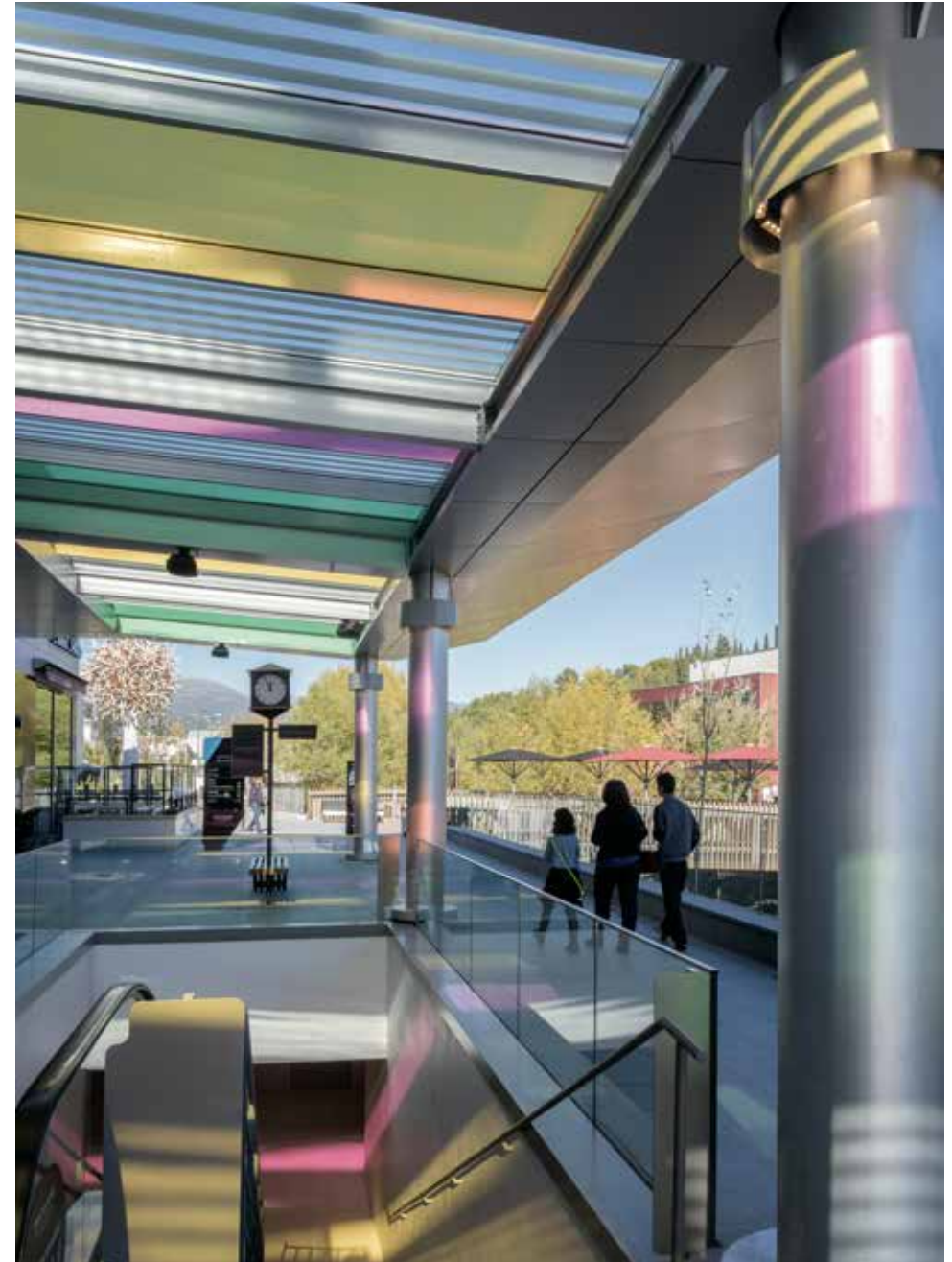
Inexorablement, les couleurs glissent, travail in situ, Cagnes-sur-Mer, 2015 Films polyester colorés, 22,6 m x 15,3 m et 4,6 m x 23,5 m

Issues d'un motif industriel qui orne nombre de stores dans le milieu des années soixante, les bandes alternées blanches et colorées - d'une largeur de 8,7 cm - sont devenues la syntaxe du langage artistique de Daniel Buren depuis 1965. C'est à partir de cet « outil visuel » que l'artiste, reconnu internationalement, explore toute une gamme de possibles et développe par la suite une réflexion sur l'in situ : ses œuvres sont intrinsèquement pensées en fonction des spécificités topologiques et culturelles des lieux qu'elles investissent, modifiant la perception de l'architecture et l'espace environnants. à Polygone Riviera, Daniel Buren investit une grande pergola qu'il pare de bandes et filtres colorés, créant un kaléidoscope lumineux changeant en fonction des rythmes du soleil. Au fil des saisons et des heures de la journée, le passage sous cette verrière n'est ainsi jamais le même, sans cesse renouvelé par l'impact des rayons et jeux de transparence.