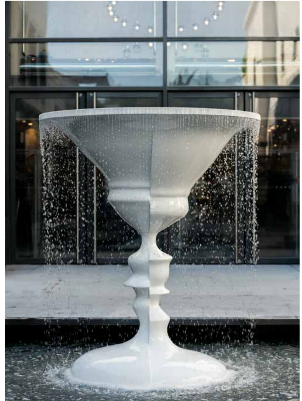
Double Negative Fountain , 2014 Aluminium, inox, 210 x 190 x 190 cm