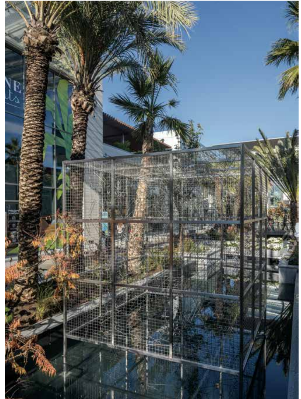
Opencage , 2015 Inox, système audio, 300 x 300 x 300 cm

Musicien et compositeur de formation, Céleste Boursier-Mougenot crée depuis une vingtaine d'année, à partir de situations ou d'objets les plus divers, des dispositifs qui révèlent leur potentiel musical. Les divers matériaux qu'il emploie dans ses sculptures et installations génèrent - le plus souvent en direct - des formes sonores qu'il qualifie de « vivantes », renouvelant ainsi la notion de partition. Entrant en relation avec les données architecturales et environnementales des lieux, chaque dispositif constitue un cadre propice à une expérience d'écoute singulière et inattendue. Posée à fleur d'eau du canal, l'oeuvre prend la forme d'une volière cubique, à l'intérieur de laquelle se déploie un réseau de cintres métalliques et de coupelles de graines. Les oiseaux des alentours entrent et sortent librement. Des microphones à contact intégrés dans la cage captent le moindre bruit produit dans le mobile de cintres oscillant sous l'action des oiseaux, et vibrant sous celle du vent ou de la pluie. Ces mouvements forment un bruit de fond continu dont le niveau sonore varie. Traité par un programme produisant une basse continue harmonique, les différents mouvements - imprévisibles - créent alors des sonorités musicales continuellement renouvelées.