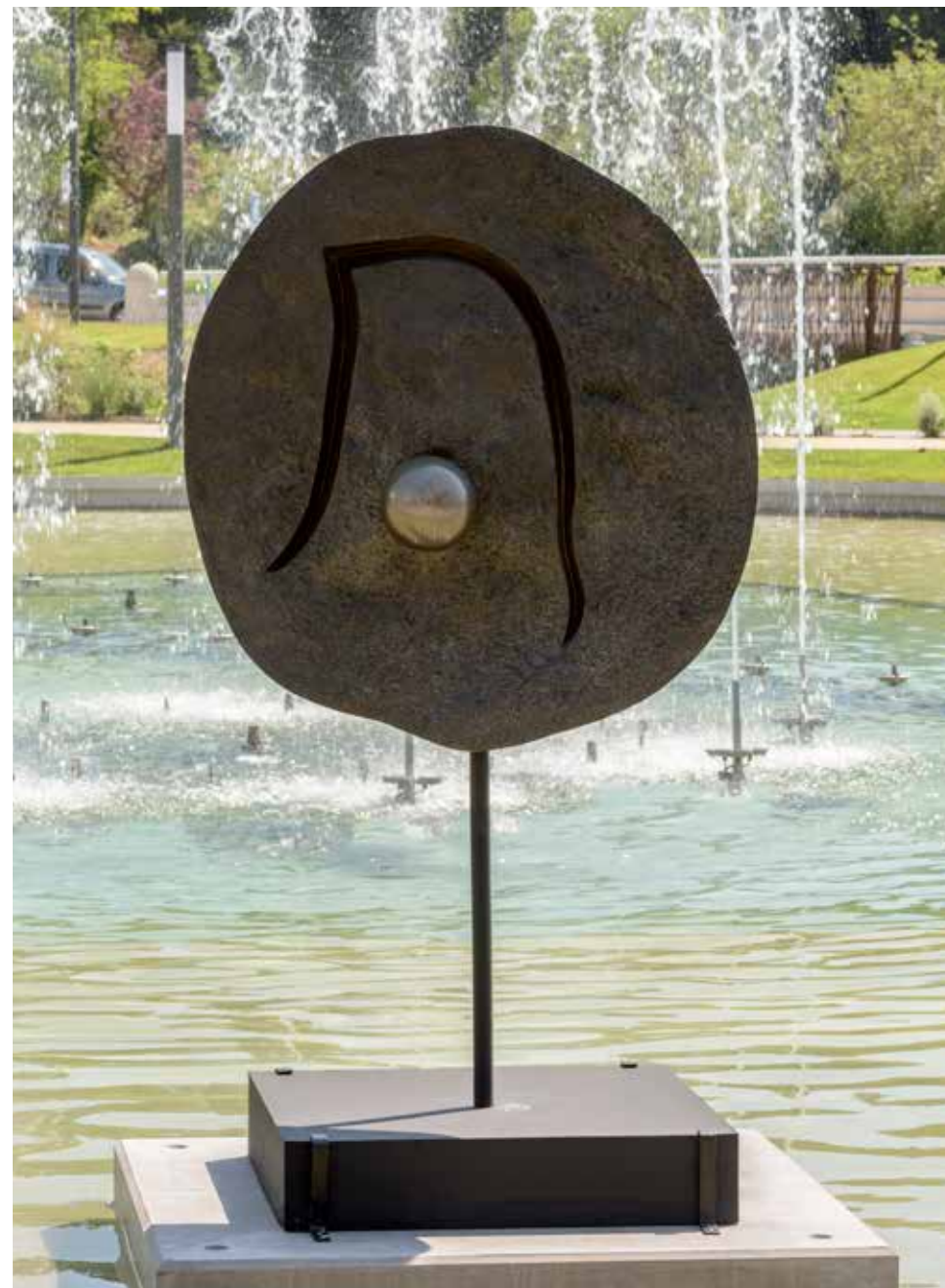
Constellation , 1971, Bronze 142 x 130 x 44 cm Susse Fondeur, Arcueil Collection Fondation Marguerite et Aimé Maeght, Saint-Paul de Vence - France

Le cosmos est un des constituants essentiel de l'œuvre de Joan Miró. Tout ce qui se passe dans ses peintures ou ses sculptures se situe sous la voie lactée ou participe au remuement des règnes et des planètes. Nous avons, ici, le sentiment d'être devant une météorite arrachée à une matière en fusion devenue pierre. À sa surface, les planètes continuent de rouler et les étoiles de tracer le dessin d'une étoile filante. Selon les heures du jour et la lumière, nous avons le sentiment d'une chute des astres ou, au contraire, d'une montée lente semblable à un lever de lune. Miró donne le battement de la vie au bronze. Il nous projette dans le ciel et donne une dimension mystérieuse à la matière noire où la boule des heures et des jours ne cesse de rouler.