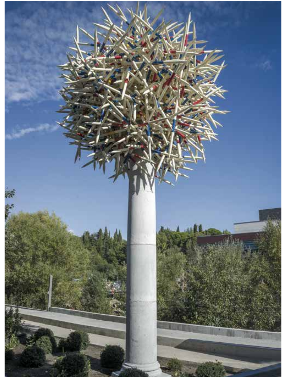
Mikado Tree , 2015 Aluminium peint, béton, acier, 790 x 400 x 400 cm

Pascale Marthine Tayou est un arpenteur du monde contemporain globalisé. Originaire du Cameroun, installé en Belgique, son vocabulaire parle d'une situation internationale de migrations, de déplacements, véhiculant à la fois contradictions, richesses et questionnements identitaires. Son travail mélange allègrement artisanat, symboles nationaux et économiques, matières organiques, rebuts de la société, références artistiques... dans des sculptures et installations foisonnantes et complexes; comme autant de points de rencontre entre les modes de vie des quatre coins de la planète. Animé d'une vision « transculturelle », Pascale Marthine Tayou manie avec légèreté et ironie ces dialogues entre les communautés. Mikado Tree est, comme son nom l'indique, un arbre dont le feuillage est en fait constitué d'un jeu de mikados géant, dont la forme s'apparente à celle d'un pissenlit. Le jeu de mikados renvoie aux notions d'habileté, d'adresse, mais également de tolérance et de confiance en soi et envers les autres. Dans un équilibre précaire, se dessinent tous les possibles: la stabilité, comme l'effondrement et le recommencement. Se présentant telle une colonne à l'allure antique, l'œuvre est ainsi un mix d'histoires passées, présentes et futures, mais aussi l'image d'une communication nécessaire entre les diverses cultures.