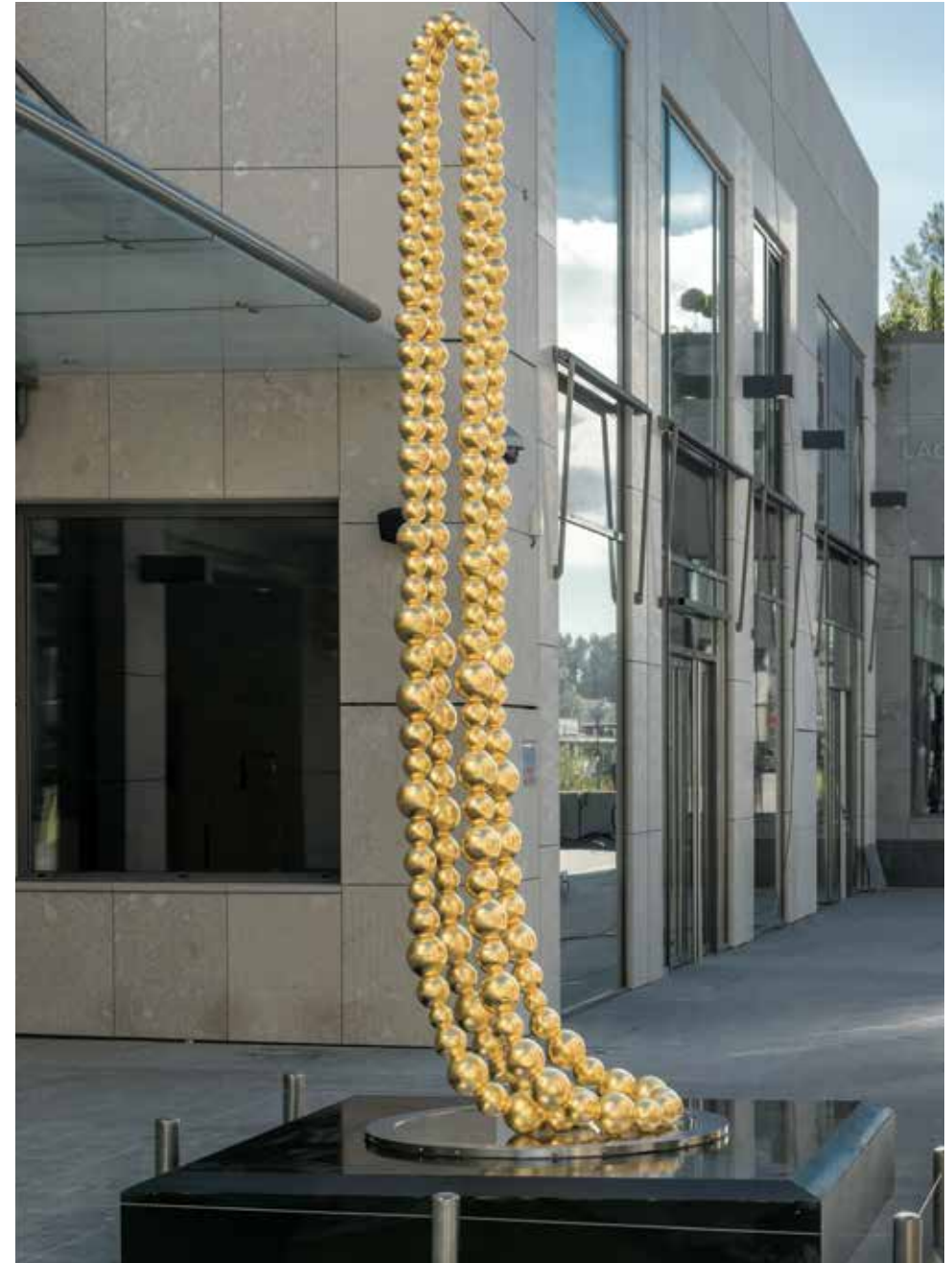
Collier doré , 2014 Aluminium, feuille d'or, inox, 405 x 120 x 120 cm

Les œuvres de Jean-Michel Othoniel, empreintes de baroque et de préciosité, s'offrent à la contemplation par leur aspect féérique. Ses sculptures et installations sont faites d'un assemblage de verre soufflé, qui, entre reflet et réalité, est devenu son matériau de prédilection. Colliers gigantesques, couronnes, lits à baldaquins aux formes évocatrices et aux couleurs chatoyantes diffractant la lumière évoquent autant de fictions pour interroger les lieux et faire rentrer le spectateur dans un conte à la charge onirique tout en questionnant les limites du genre féminin/masculin, végétal/minéral, artificiel/naturel... Enigmatique sculpture recouverte de feuille d'or, le Collier doré de Jean-Michel Othoniel se présente tel un fruit défendu, entre bijou et élément d'architecture. L'artiste s'est approprié la forme traditionnelle du collier comme parure, composé de perles de différentes grosseurs percées dans leur longueur, pour créer un objet ambivalent, entre ornement et fragilité. Comme suspendu à un fil invisible, il repose délicatement sur une plaque miroir, reflétant sa verticalité. De cet objet fétiche devenu gigantesque, émane une dimension majestueuse, calme et intemporelle.