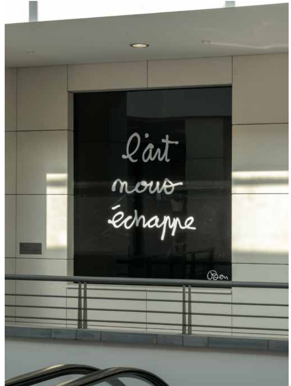
L'art nous échappe , 2015 Peinture sur Dibond, 200 x 200 cm

Devenu célèbre pour ses peintures - écritures blanches sur fond noir, ses installations et performances, Benjamin Vautier - dit Ben - fait partie de l'avant-garde artistique post-moderne. Proche du Lettrisme, il est par ailleurs l'un des principaux fondateurs du groupe Fluxus. La cultivation de son égo est un thème essentiel et récurrent dans son travail, qui rend compte avec une certaine légèreté et ironie, d'un statut complexe de l'artiste face au monde actuel et à ses exigences. Son œuvre, à la fois réflexion sur l'art dans ce qu'il a de plus fondamental et intégrant notre quotidien dans ce qu'il a de plus particulier, réussit à faire de la vie un art. Peintes en blanc sur fond noir, puis encastrées dans un mur de Polygone Riviera, les phrases inédites de Ben ( L'art nous échappe ; Réinventer le monde ), à l'écriture soigneusement calligraphiée, clament des idées simples et facétieuses, mais derrière lesquelles se lit toujours un concept fort : celui d'un art de l'idée, qui ouvre dès lors toute discussion possible. Les pensées de Ben, ainsi écrites et portées au regard de tous, sont à la fois des vérités, des commentaires sur le monde et l'actualité, des scénarii, des invectives ou de simples constatations. Ici, la phrase remplace et devient l'image, à la fois d'une réflexion personnelle mais aussi d'un inconscient collectif.