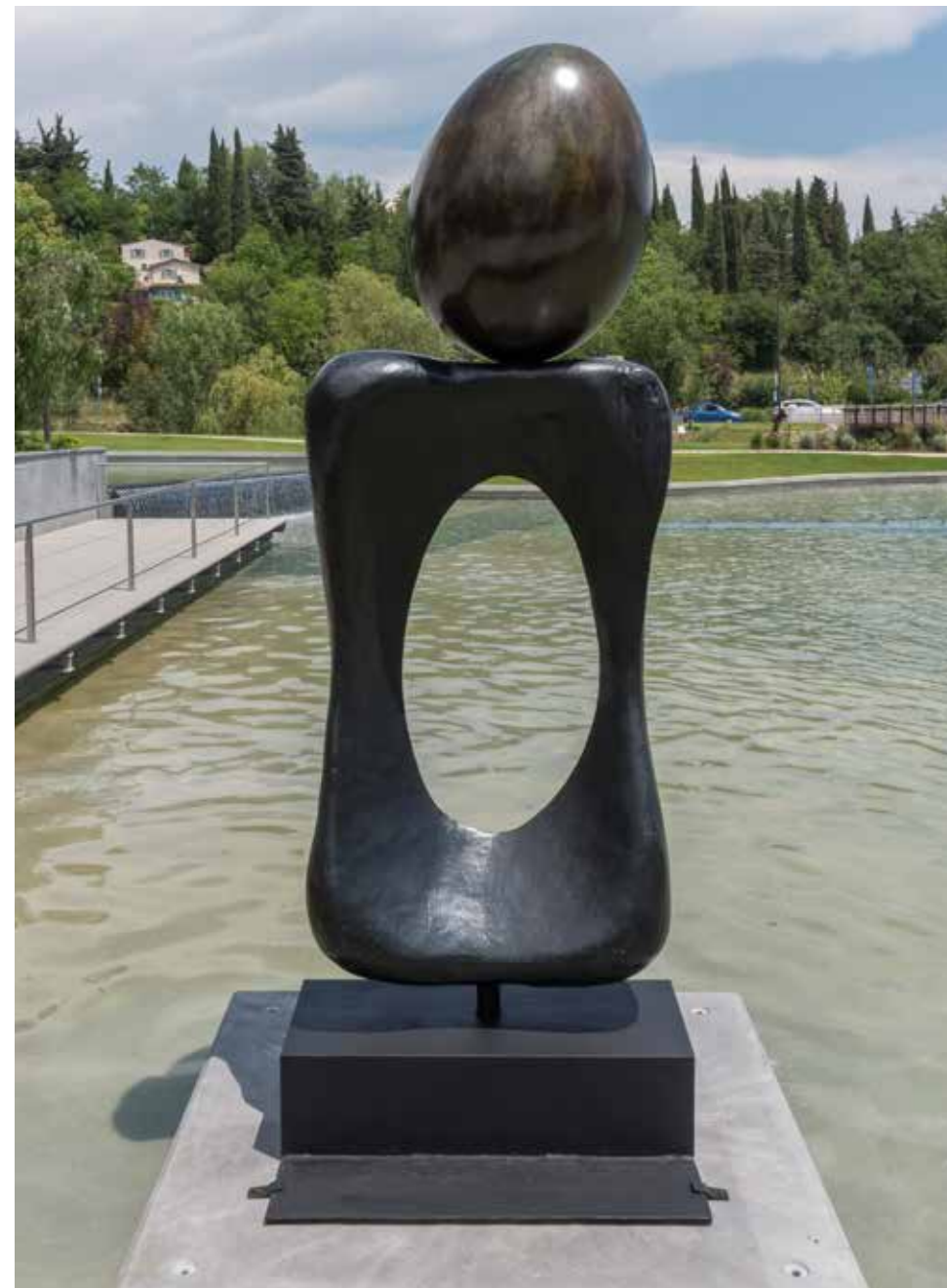
Monument , 1970 Bronze, 250 x 100 x 50 cm Fonderie Fratelli Bonvicini, Vérone (Italie) Fondation Marguerite et Aimé Maeght, Saint-Paul de Vence - France

Miró dans son œuvre rend hommage et dédie des monuments à l'immatériel, à la puissance du rêve, à des principes comme l'amour ou la vitalité de la matière. L'œil, l'œuf sont par exemple, des figures et des formes récurrentes dans ses créations. Ici l'œuf, symbole de la naissance, se dégage d'une gangue noire et dense, pour dévoiler l'autre côté des choses, un paysage, un horizon, une autre nature. Il nous invite à traverser le mur, le miroir, pendant que l'œuf dégagé de la pesanteur s'envole comme un oiseau pour se percher en haut du monument. Cette sculpture est un éloge de ce qui s'échappe, qui se dérobe à la gravitation et au poids des choses. Elle rend hommage à tous ceux qui volent comme à ceux qui choisissent de se libérer des lois convenues de la nature.