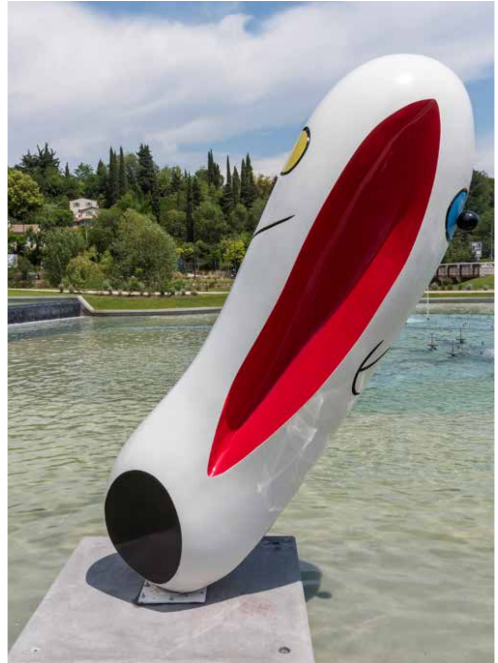
Personnage , 1972, Résine synthétique peinte 320 x 120 x 100 cm Haligon, reproducteur statuaire, Périgny-sur-Yerres Collection Fondation Marguerite et Aimé Maeght, Saint-Paul de Vence - France

Le personnage que sculpte Joan Miró est un personnage né après les grandes aventures spatiales et les premiers pas sur la lune des années 1960. Il est réalisé en époxy, matériau neuf de l'époque. Il a la forme, à la fois d'un vaisseau spatial, futuriste et celle d'une figure signifiant l'origine du monde à travers la synthèse d'une forme phallique masculine et d'un sexe féminin réunis dans ce qui est une nouvelle représentation de l'androgynisme primordial. Cet être hybride porte également, tatoué sur sa surface, les mouvements de la lune, du soleil, des étoiles et possède sur son flanc un œil qui scrute l'espace. Miró invente un personnage digne de la guerre des étoiles qui, depuis les contes de son enfance rejoint un imaginaire qui lui permet de s'aventurer dans un monde fait d'ondes gravitationnelles, de trous noirs, des lumières fossiles du Big Bang. Sa sculpture vient-elle des origines ou au contraire surgit-elle d'un futur inconnu ?