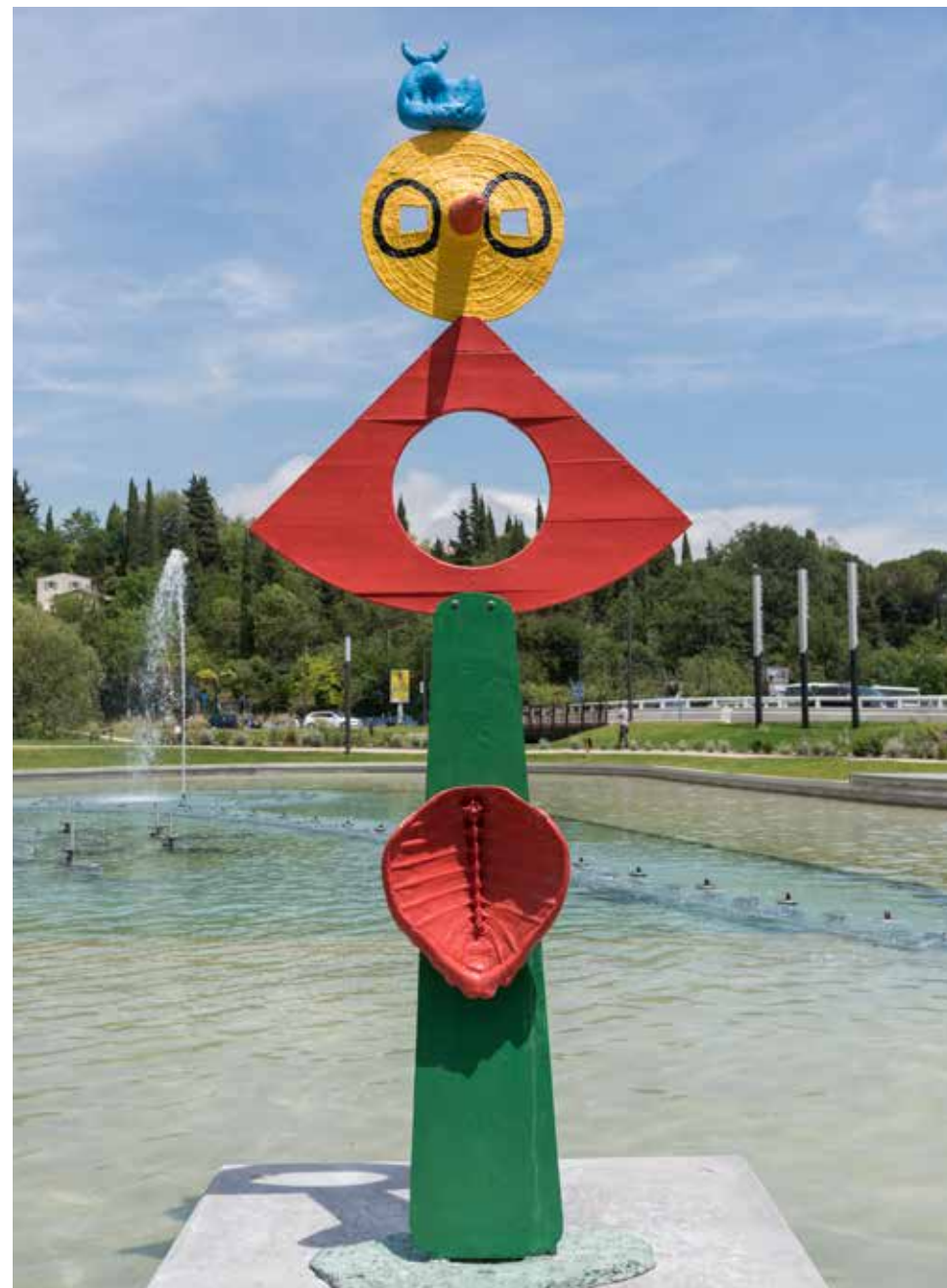
La Caresse d'un oiseau , 1967, Bronze peint, 315 x 112 x 42 cm Susse fondeur, Arcueil Collection Fondation Marguerite et Aimé Maeght, Saint-Paul de Vence - France

Ce titre pourrait être celui d'un poème de son ami Jacques Prévert. Poète, Miró l'est à chaque instant de sa création, avec les formes et les couleurs. Ici, avec les trois couleurs primaires : le bleu, le jaune et le rouge qu'il fait « vibrer » avec un vert profond. Ce personnage est proche d'un oiseau mais d'un oiseau qui serait aussi clown ou héros du Magicien d'Oz. Miró, maître du collage en sculpture, fait exister sa créature, en assemblant des formes qui appartiennent déjà à la réalité. Il les transforme et les assemble. L'inventaire est fait d'un plan vert d'une table à repasser, du rouge d'une carapace de tortue, d'une lunette vermillon d'une toilette de campagne, d'un chapeau de paille jaune percé de deux trous, cerclés de noir, qui se métamorphosent en deux yeux encadrant un nez rouge, au sommet du couvre-chef. Tout cela forme un visage couronné d'une aigrette bleue faite d'une pierre et d'un petit arc ramassé sur le sol de l'atelier. Cette sculpture légère, traversée par l'air, est le résultat d'un assemblage, joyeux, joueur, d'une grande habileté et d'une liberté suprême. Sa caresse nous emporte sur les ailes du rêve.