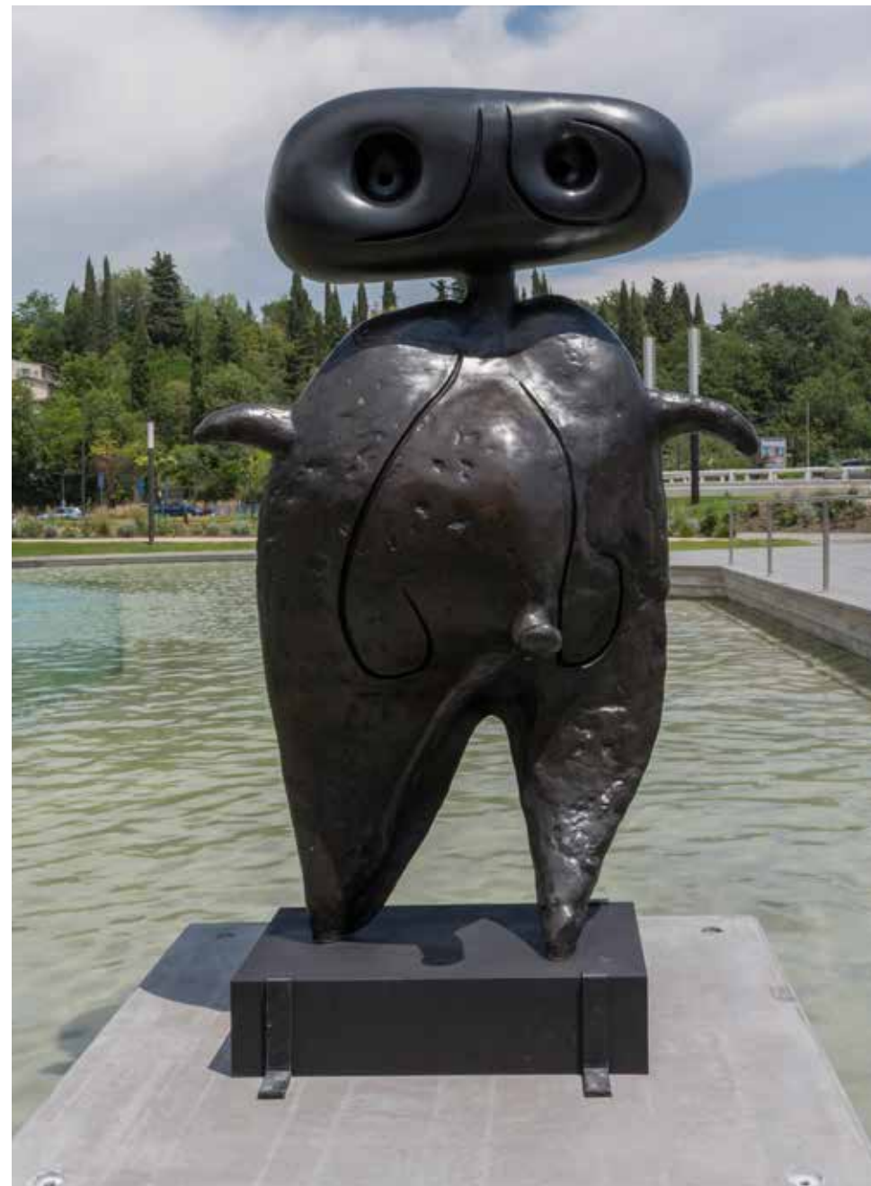
Personnage , 1970 Bronze, 200 x 120 x 100 cm Fonderie Fratelli Bonvicini, Vérone (Italie) Collection Fondation Marguerite et Aimé Maeght, Saint-Paul de Vence - France

D'un bronze très sombre, il exprime à la fois la surprise, l'étrangeté et le mouvement. Cet être nous regarde et vient vers nous. C'est à la fois un primitif et un être de science-fiction, fruit de notre imagination. Les habitués de la Fondation Maeght le surnomment affectueusement « E.T. ». Toute la question est, alors, de savoir, à travers lui, vers quel monde Miró veut nous entraîner, vers quelle « maison » imaginaire il souhaite nous conduire.