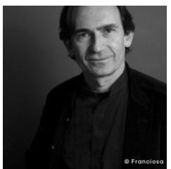
Benoît Peeters Écrivain, scénariste et critique.