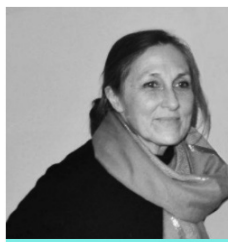
Sylvie Denoix Historienne, spécialiste des villes du monde musulman médiéval, directrice de recherche, CNRS.