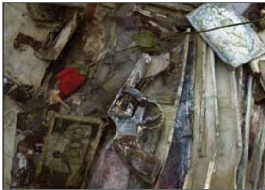
Stanley GREENE / NOOR

SAMEDI 8 SEPTEMBRE : Quartet Blue jazz group au complet