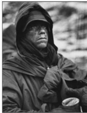
David Douglas DUNCAN