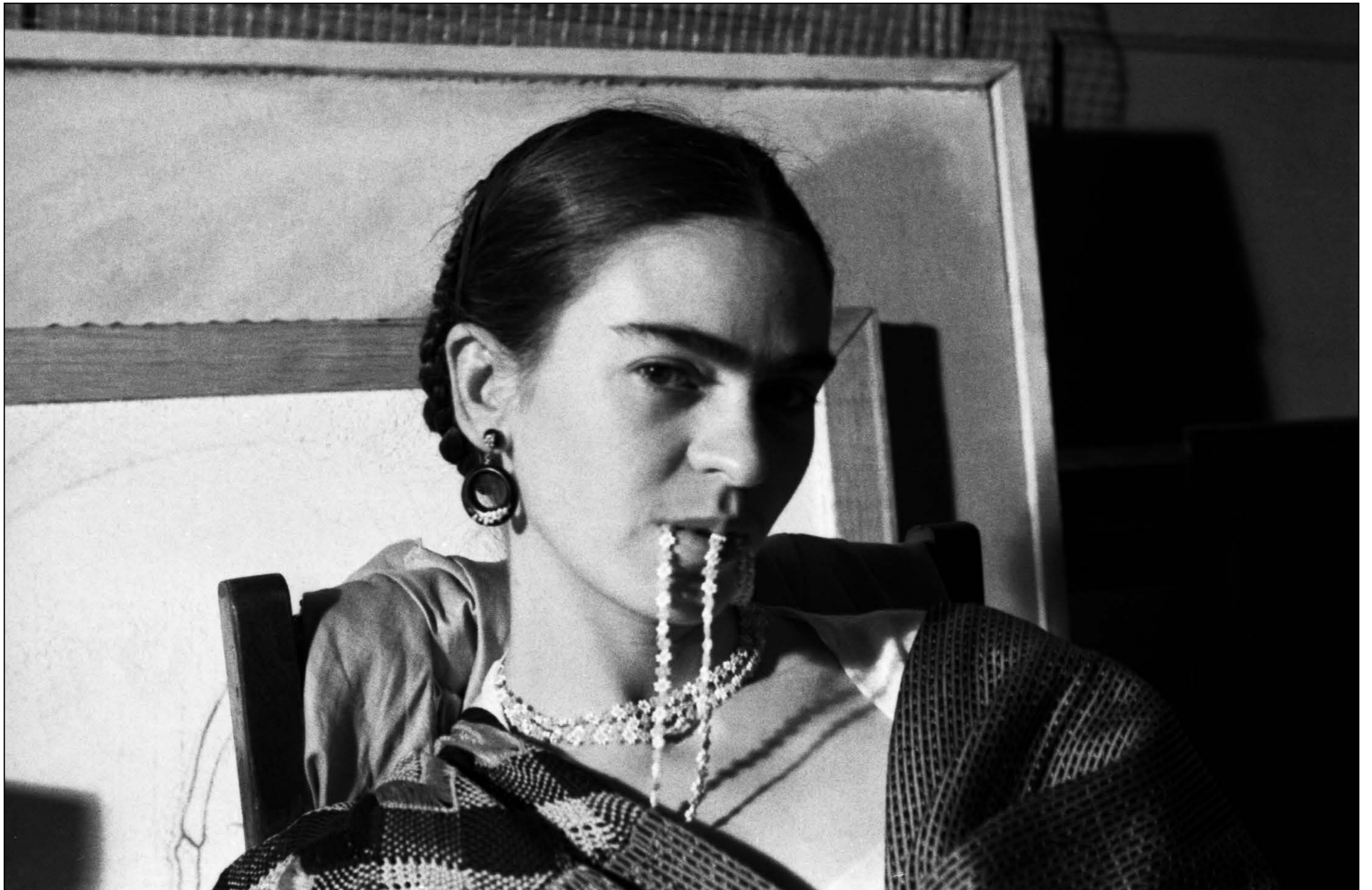
Frida Biting her Necklace, New Workers School, NYC, 1933