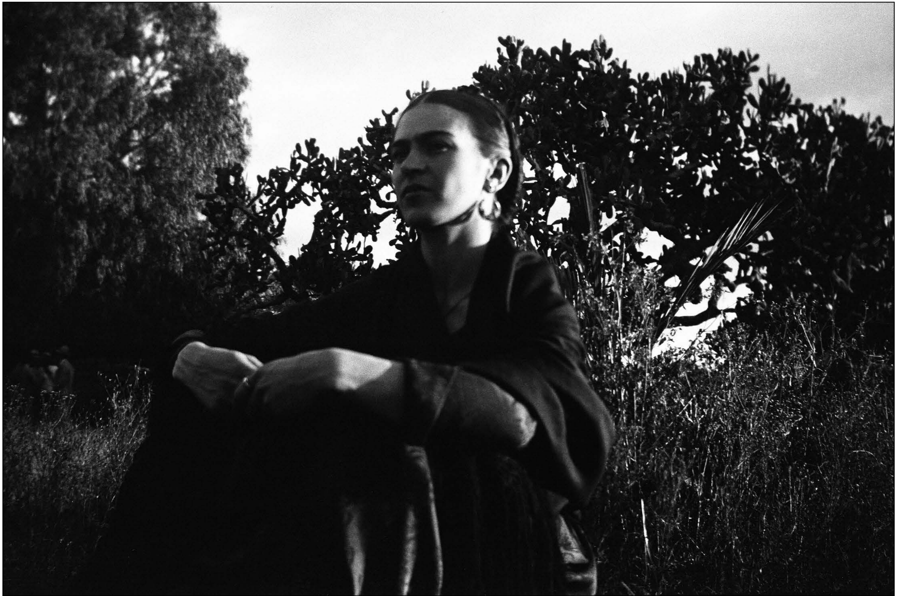
Frida by the Cactus, Mexico, 1932