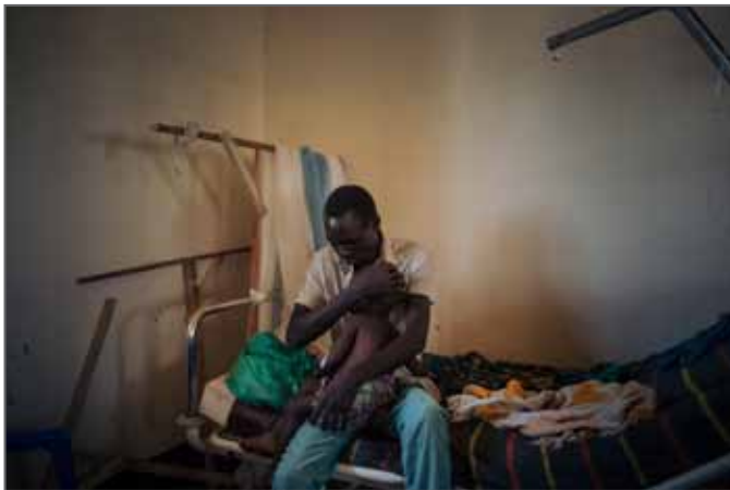
THE FORGOTTEN EPIDEMIC – D.R. CONGO