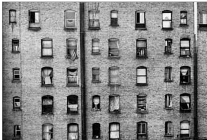
THE AIDS HOTEL