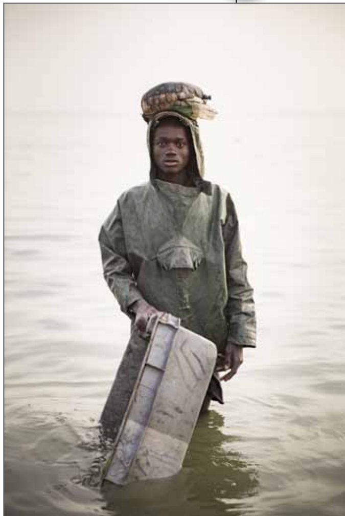
ECOLOGICAL DISASTERS