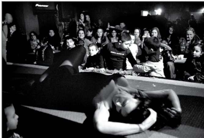
SPINA, NAPLES (1996-2016)