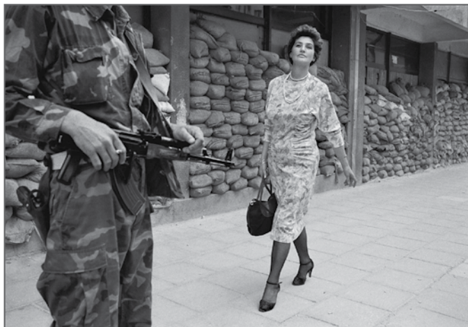
EXTRAORDINARY WOMEN