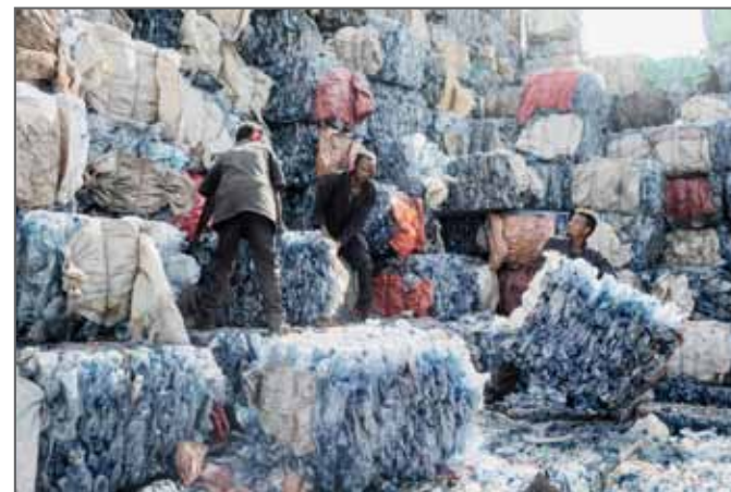
ETHIOPIA - RECYCLING PLASTIC