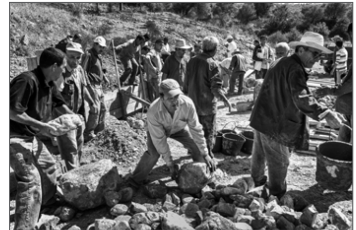
TAJMAAT, A TRADITIONAL FORM OF PARTICIPATORY DEMOCRACY IN KABYLIA