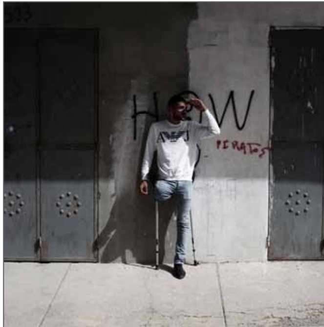
TUNISIA – TODAY'S YOUNGER GENERATION