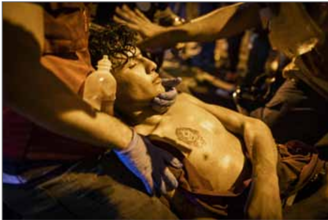
"ONLY GOD CAN JUDGE ME" - IRAK 2018-2019