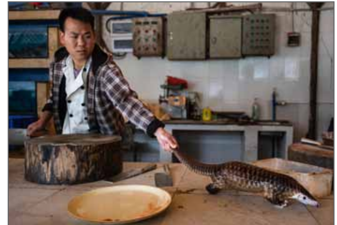
PANGOLINS IN CRISIS