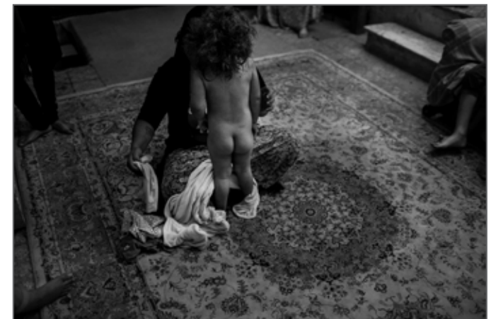
A MEMOIR OF PANIC AND ADDICTION