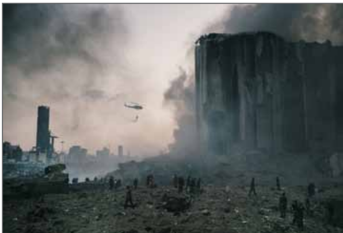
BEIRUT – AUGUST 2020

INSTAGRAM: @Lorenzotug WEBSITE: www.lorenzotugnoli.com