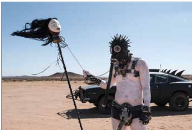
THE WASTELAND FESTIVAL - USA