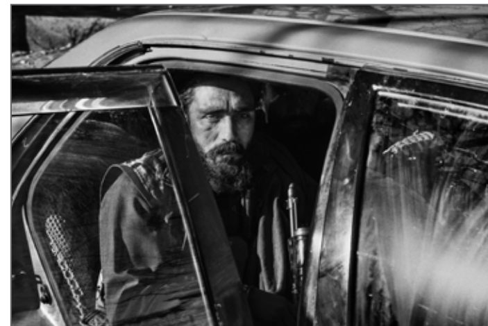
AFGHANISTAN, THE LONGEST WAR © Lorenzo Tugnoli / Contrasto for The Washington Post

INSTAGRAM: @Lorenzotug WEBSITE: www.lorenzotugnoli.com