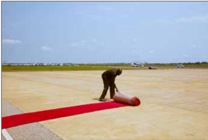
SOUTH SUDAN - THE ROAD TO PEACE © Alex McBride

INSTAGRAM: @alex.mcbride WEBSITE: www.alexmcbride.com