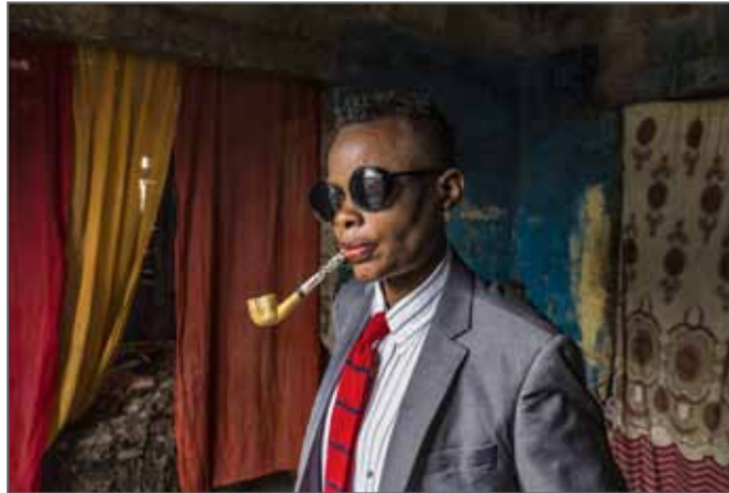
SAPEURS: LADIES AND GENTLEMEN OF THE DRC

TWITTER: tariqzaidipho INSTAGRAM: tariqzaidipho FACEBOOK: TariqZaidiPhotography WEBSITE: www.tariqzaidi.com