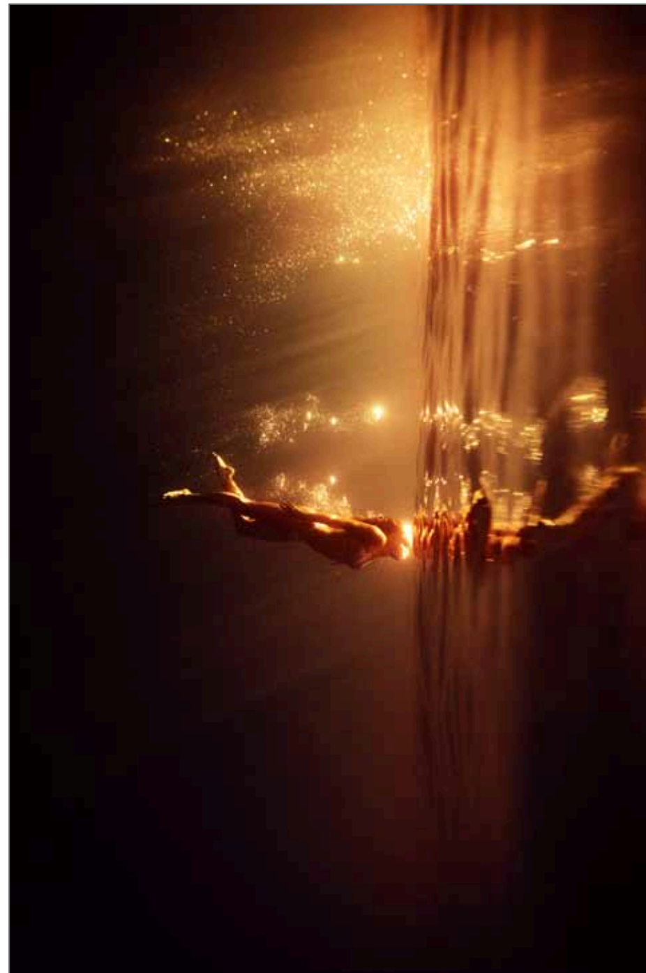
Série The wall