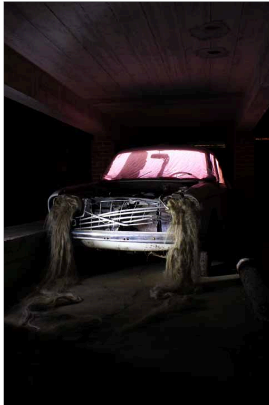
Parlez moi d'amour

Née en 1994 en Normandie, après l'obtention d'un Bac Littéraire option Arts Plastiques en 2012, j'ai intégré l'École des Beaux-Arts de Rouen. C'est au sein de ce cursus que mon intérêt pour le médium photographique s'est manifesté. Cet établissement m'a permis de développer une réflexion artistique et de trouver mon propre univers. En 2017, j'ai obtenu mon DNSEP (Diplôme National Supérieur d'Expression Plastique) avec les félicitations du jury. Ce master m'a apporté un bon bagage artistique, mais j'étais soucieuse de mon manque de connaissance dans le domaine technique de la Photographie, j'ai donc décidé de continuer mon parcours scolaire. Après avoir passé le concours, cette année j'ai eu la chance et le plaisir d'intégrer la section Photographie de l'École de l'Image des Gobelins.