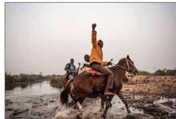
Série Les cowboys sont toujours noirs © Aurélien Gillier