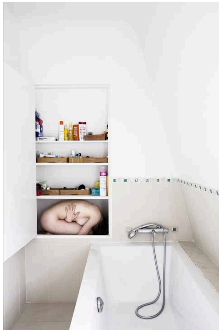
Série L'élément du décor

Lauréate du Grand Prix Paris Match Photo Reportage Étudiant 2016, Prix spécial du Jury, Clémence Losfeld est membre du studio Hans Lucas depuis octobre 2016.