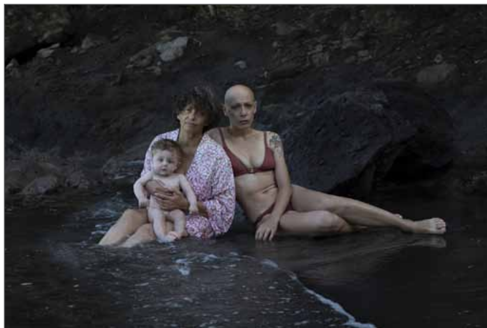
Série Case Pilote