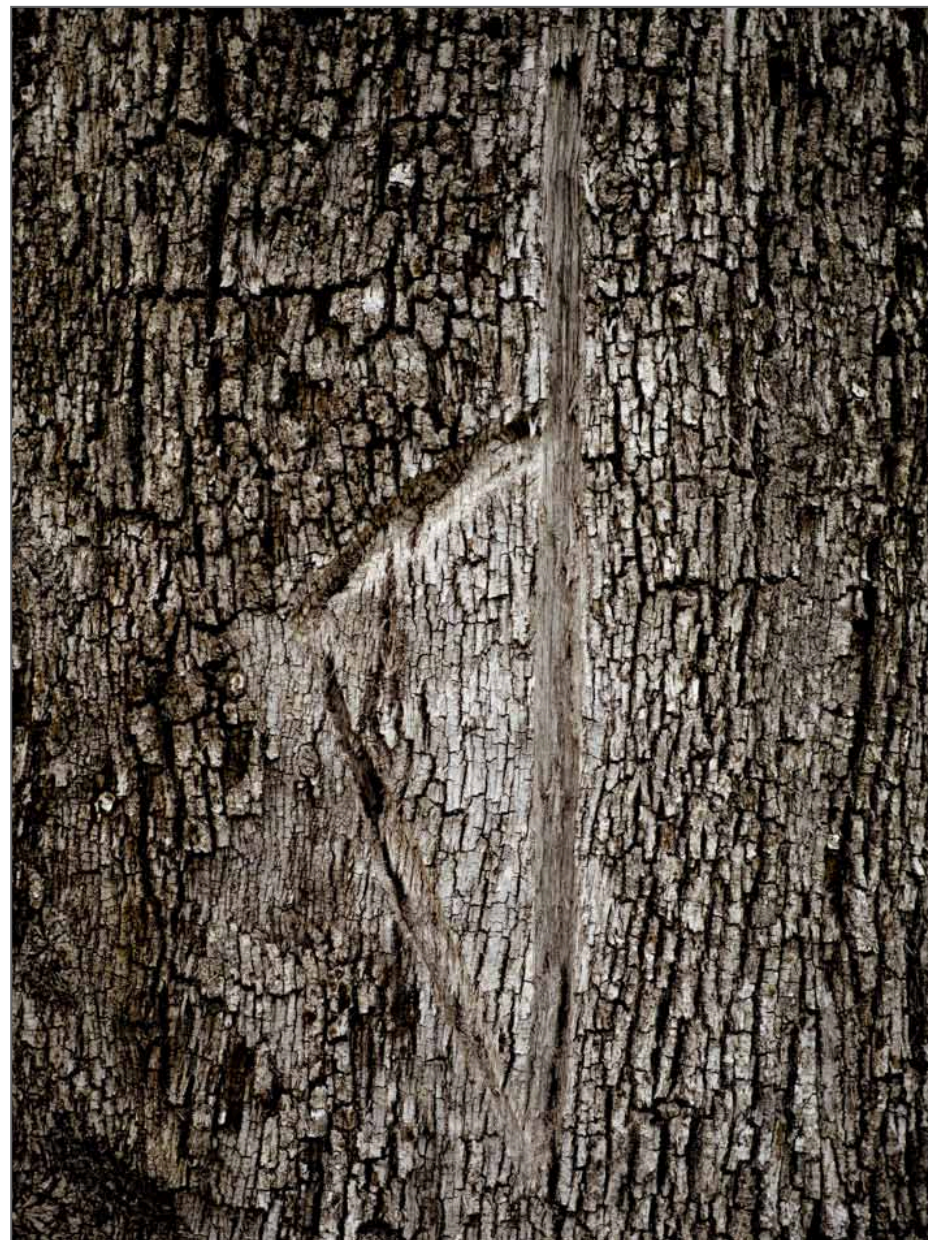
Une Corse stylisée gravée dans un chêne liège sur la route de Conca, 2018. De la série Qui, ancu i muntagni si scontrani