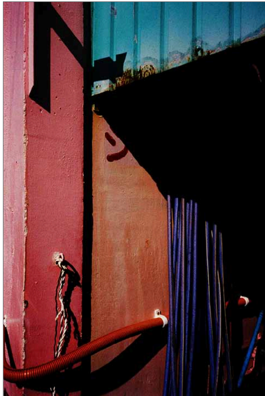
Série Black is burned

En 2018 est publié 8 , son second livre chez Poursuite, puis Red Harvest chez le même éditeur. Elle collabore avec des magazines et des journaux français et internationaux en tant que reporter photo et photographe de portrait ainsi qu'en tant que photographe de mode pour plusieurs marques. Elle est représentée par la galerie française Made et la galerie portugaise Carlos Carvalho ainsi que par des agences en France et en Angleterre.