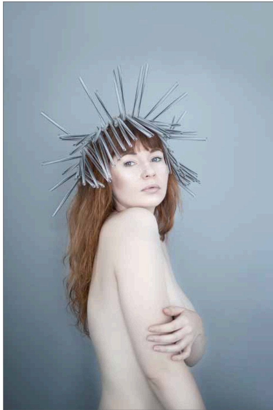
Série Re-cycle