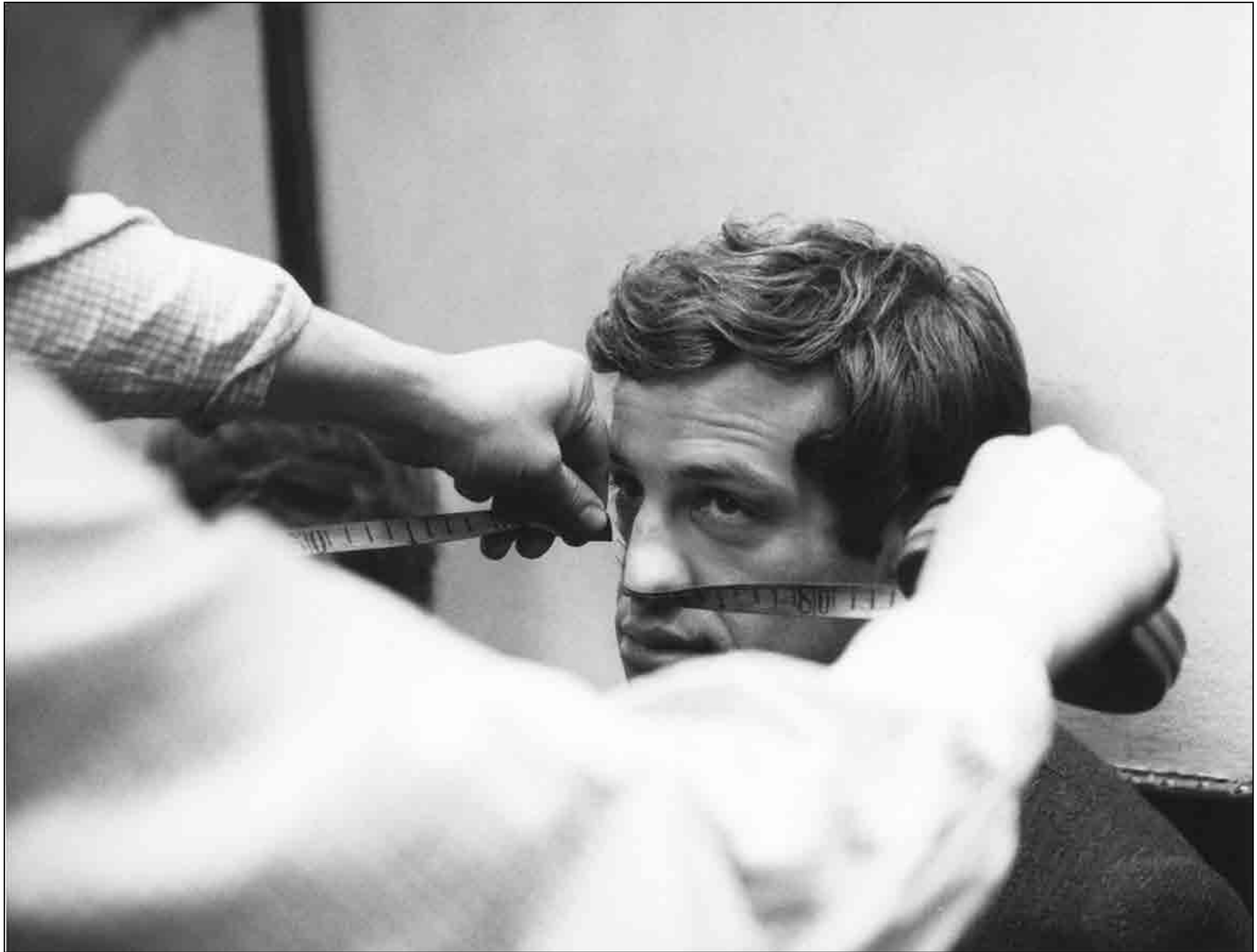
Une Femme est une Femme - Jean-Luc Godard - 1961 - Jean-Paul Belmondo - Paris