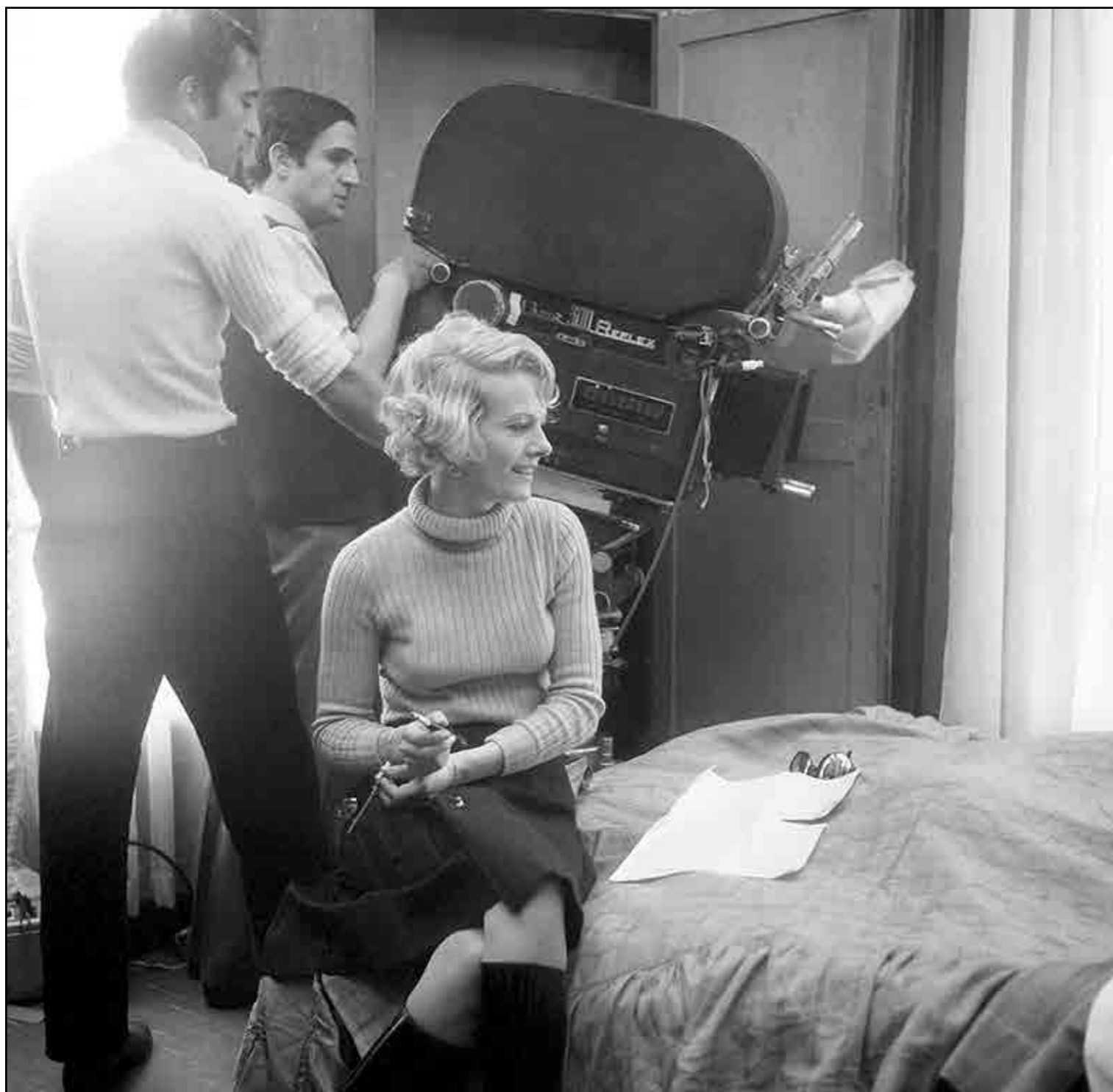
Baisers Volés - François Truffaut - 1968 Delphine Seyrig, Paris