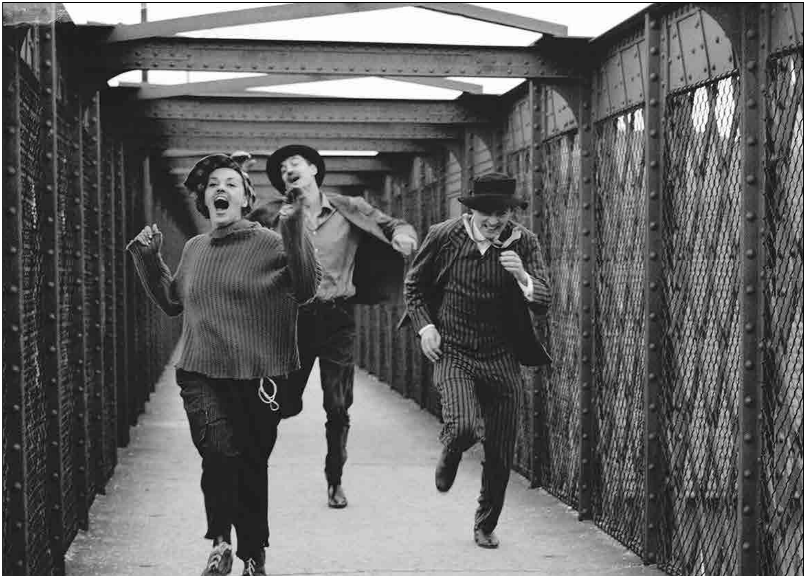
Jules et Jim - François Truffaut - 1961 - Jeanne Moreau, Henri Serre, Oskar Werner - Charenton-le-Pont - Paris