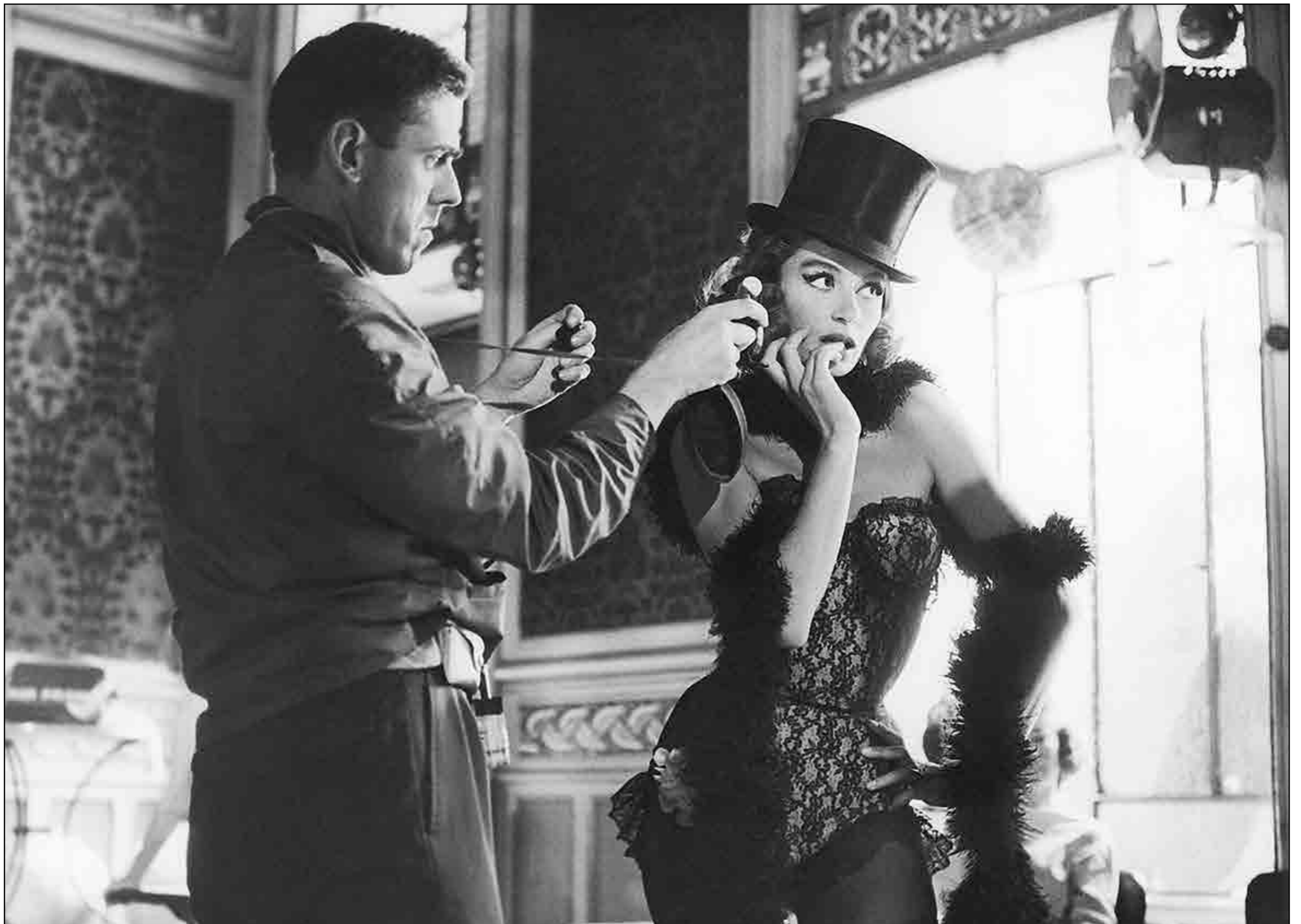
Lola - Jacques Demy - 1960 - Anouk Aimée - Nantes