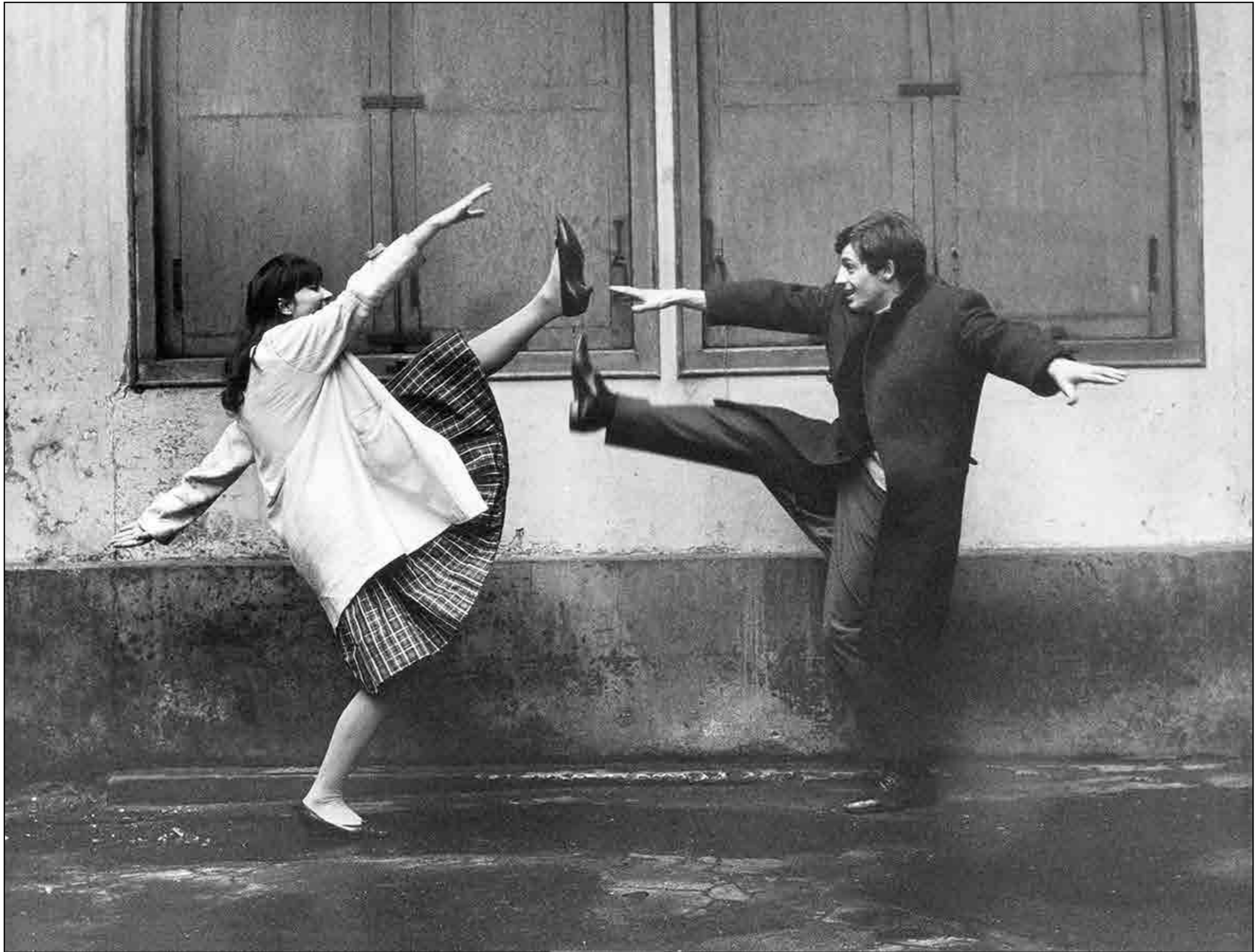
Une Femme est une Femme - Jean-Luc Godard - 1961 - Anna Karina, Jean-Paul Belmondo - Paris