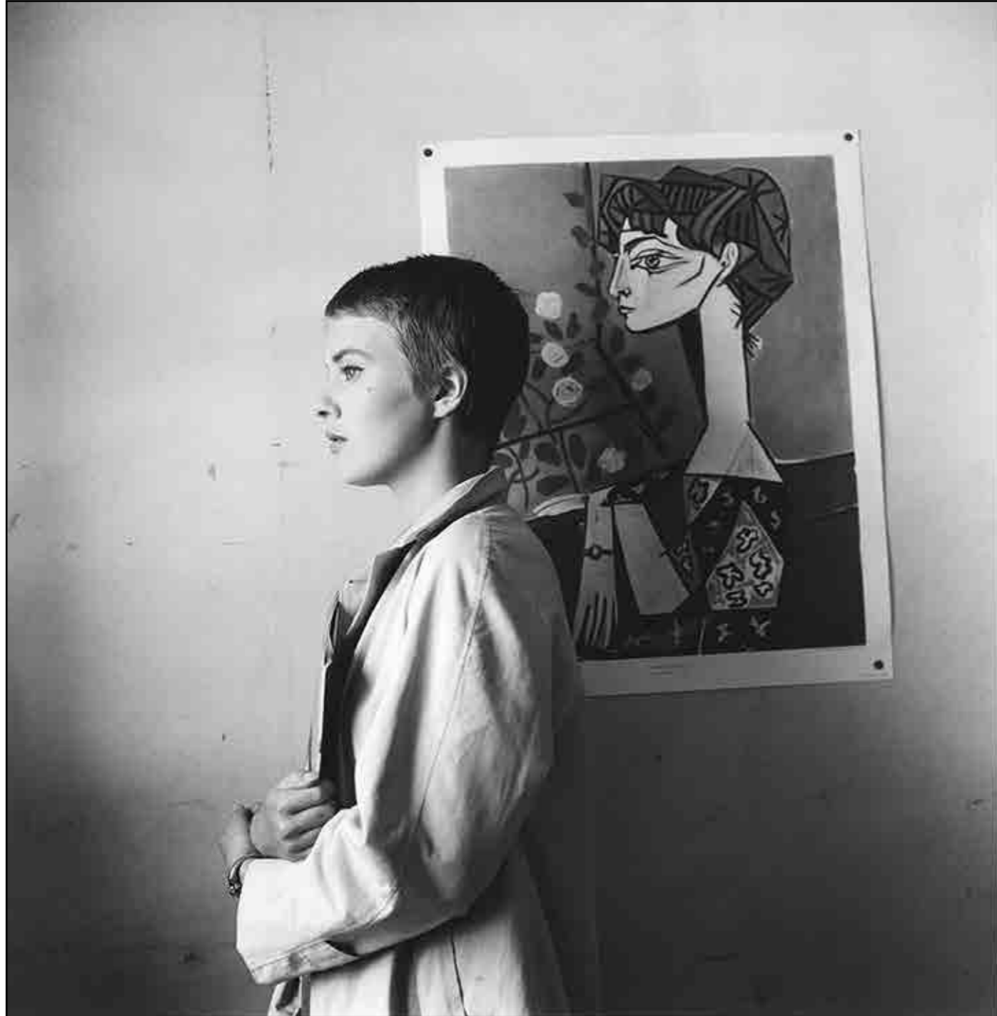
À bout de souffle - Jean-Luc Godard - 1959 Jean Seberg, Hôtel de Suède, Quai Saint Michel, Paris